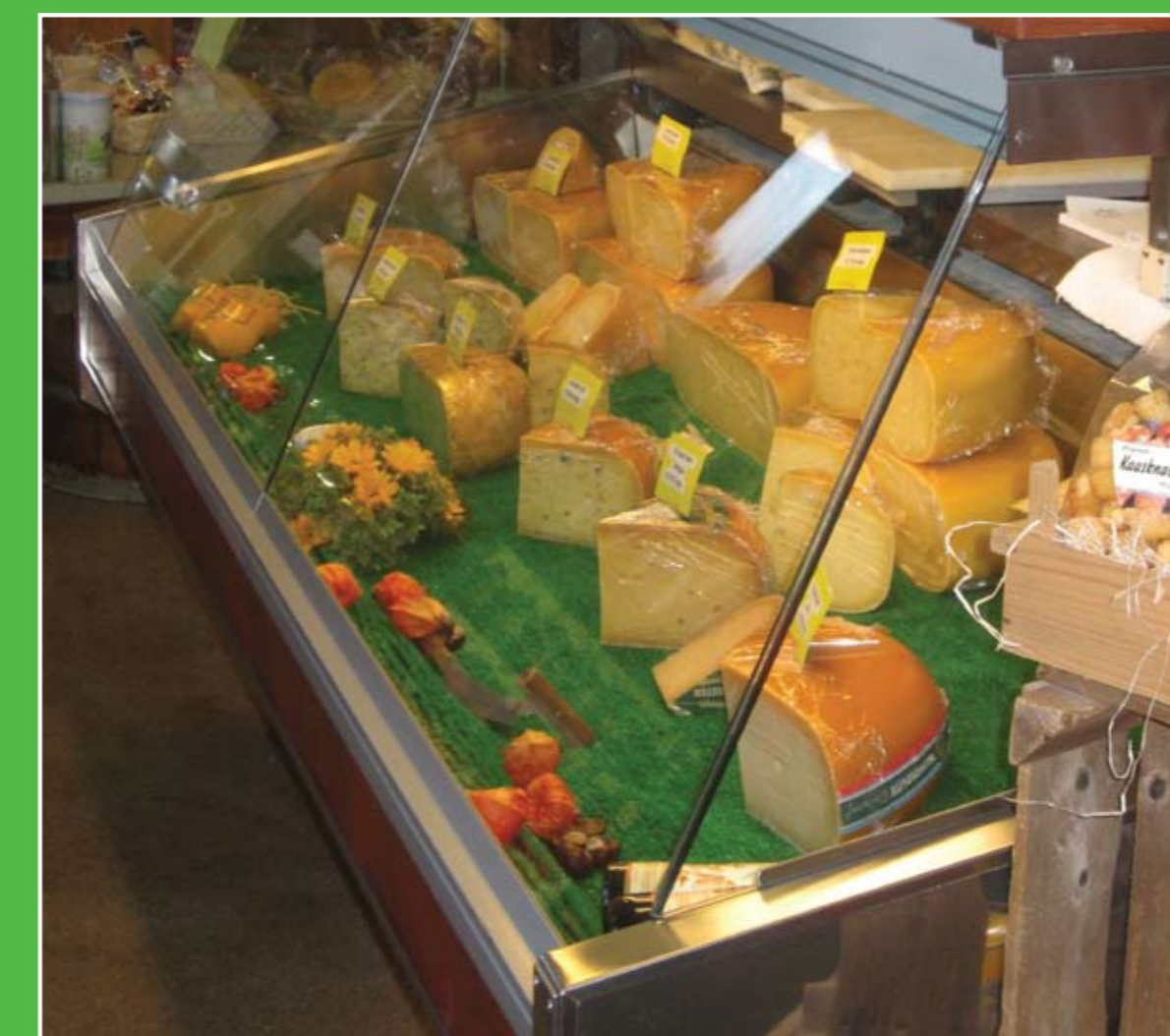
④ Kaasboerderij De Kastanjehoeve

Adres: Lekdijk 48, Langerak. Openingstijden: di-vr-za 10.00-17.00 uur.