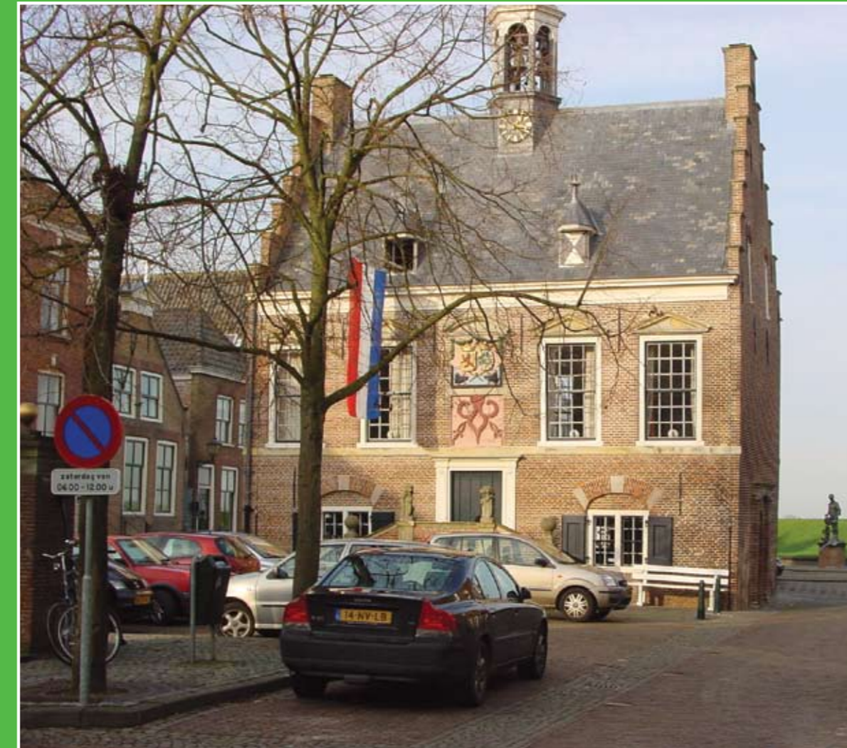
① Stadhuis Ameide

Het buitengebied van Ameide, de Alblasserwaard en Vijfheerenlanden, kent een puur Hollands landschap met groene weiden, knotwilgen, molens, typische dijkdorpen en historische boerderijen. Een regio die bij uitstek geschikt is om heerlijk te wandelen of fietsen.