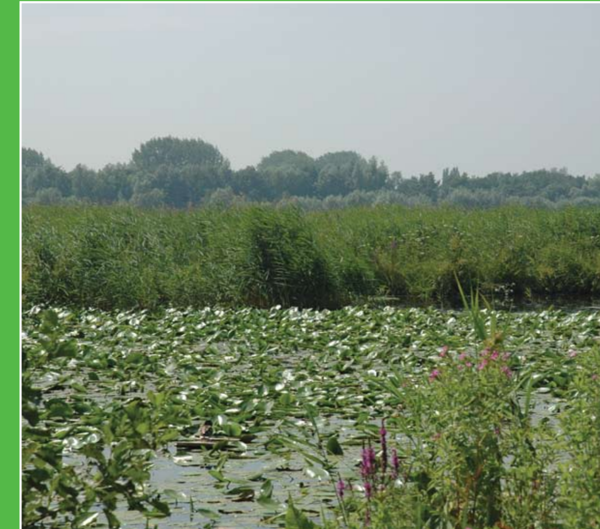
② Natuurgebied Zouweboezem