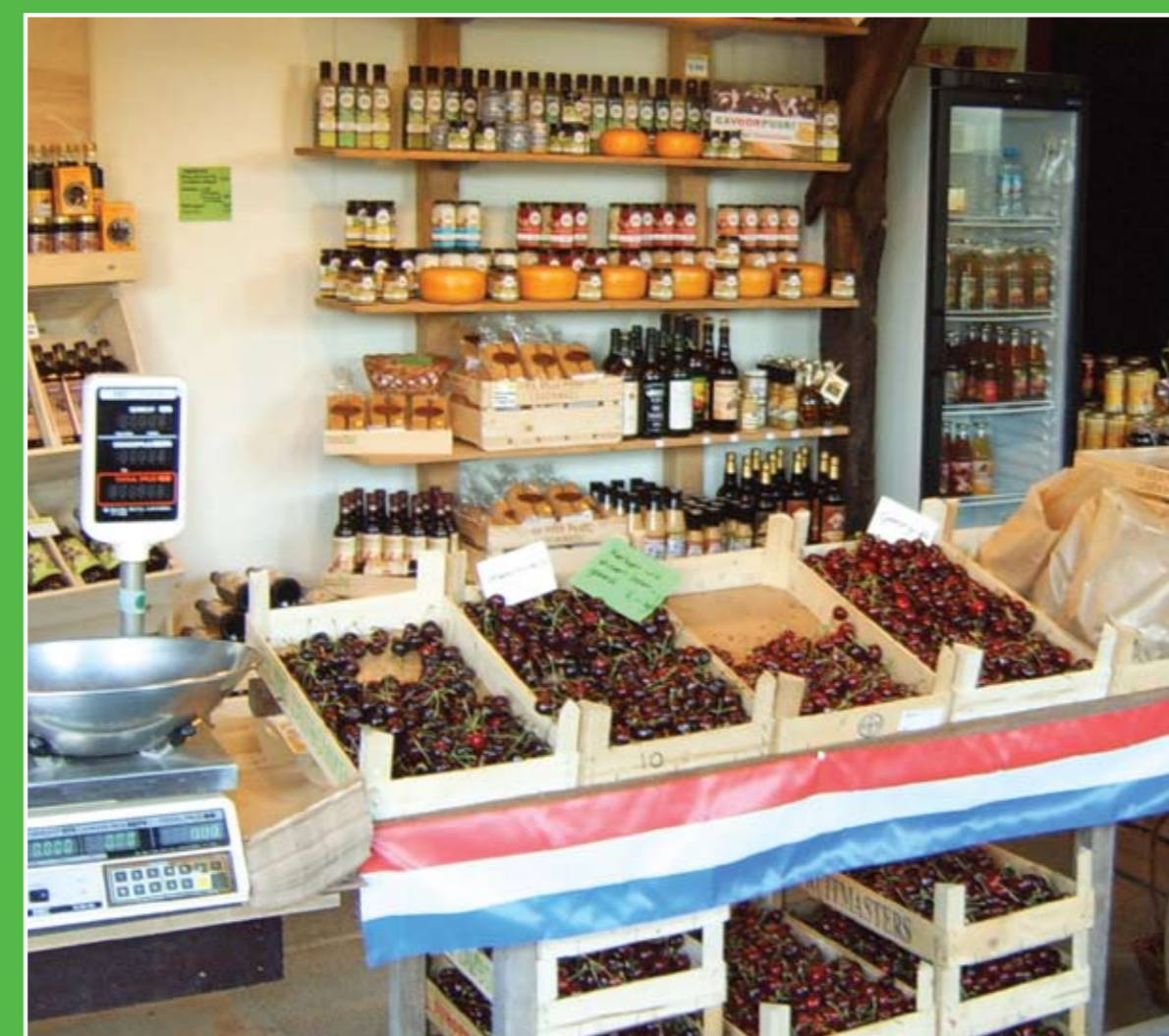
③ Landwinkel Pek

Het vrij toegankelijke natuurontwikkelingsgebied de Zouweboezem bestaat voor het grootste gedeelte uit een moerassige vegetatie van lisdodde, mattenbies en pitrus. Ook komen hier talrijke moeras- en rietvogels voor. Via het vlinderpad wandelt u naar een vogelkijkscherm en aan het einde van de Boezemweg is een vogelkijkhut. Ingang en parkeerplaats: Boezemweg, bij het buurtschap Sluis nabij Ameide.