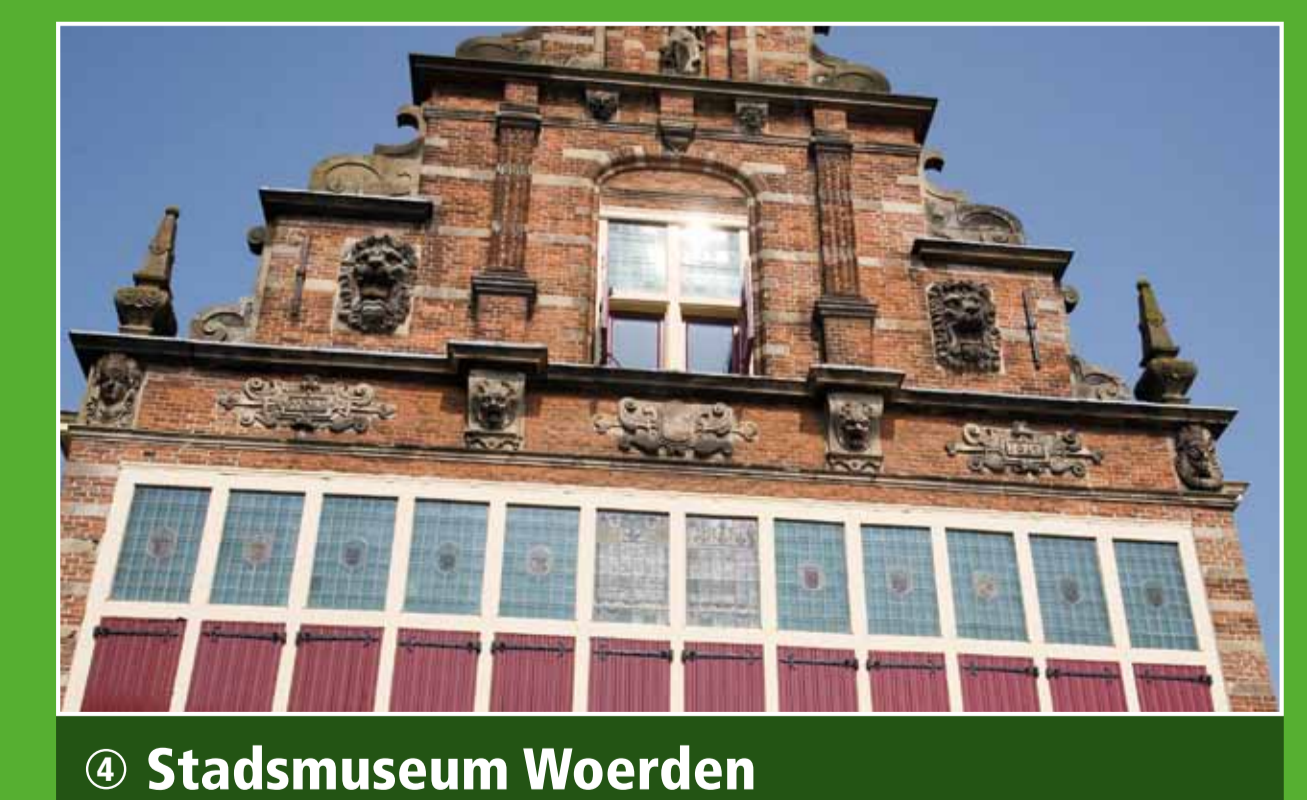
4 Stadsmuseum Woerden

Informatie over het gebied 'De Venen' vindt u in het Bezoekerscentrum Oortjespad, direct bij de TOP. Voor kinderen valt er veel te beleven en ontdekken. De vaste tentoonstelling geeft antwoord op vragen zoals welke dieren in de sloot leven en welke weidevogels je hoort. Naast het bezoekerscentrum ligt een kinderboerderij.