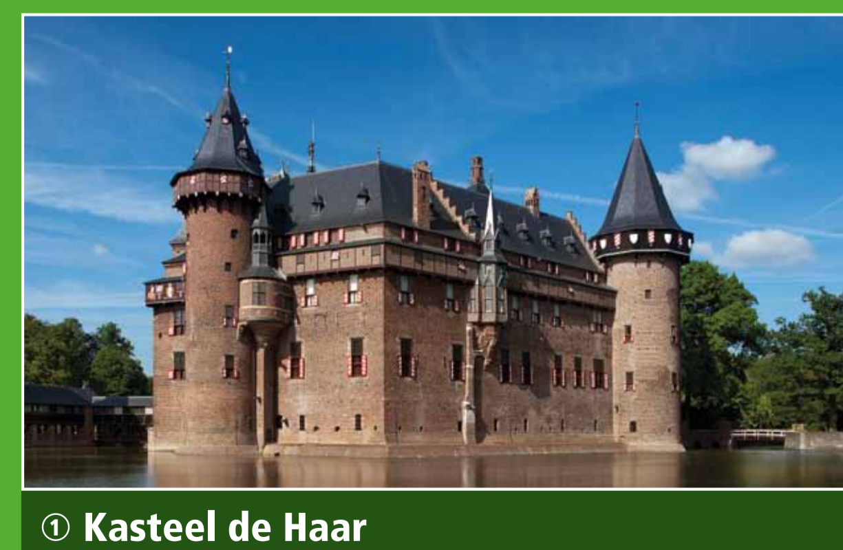
1 Kasteel de Haar

Het Groene Hart ligt voor het grootste deel onder de zeespiegel. Momenteel bevindt u zich op 1,70 meter onder NAP (Normaal Amsterdams Peil).