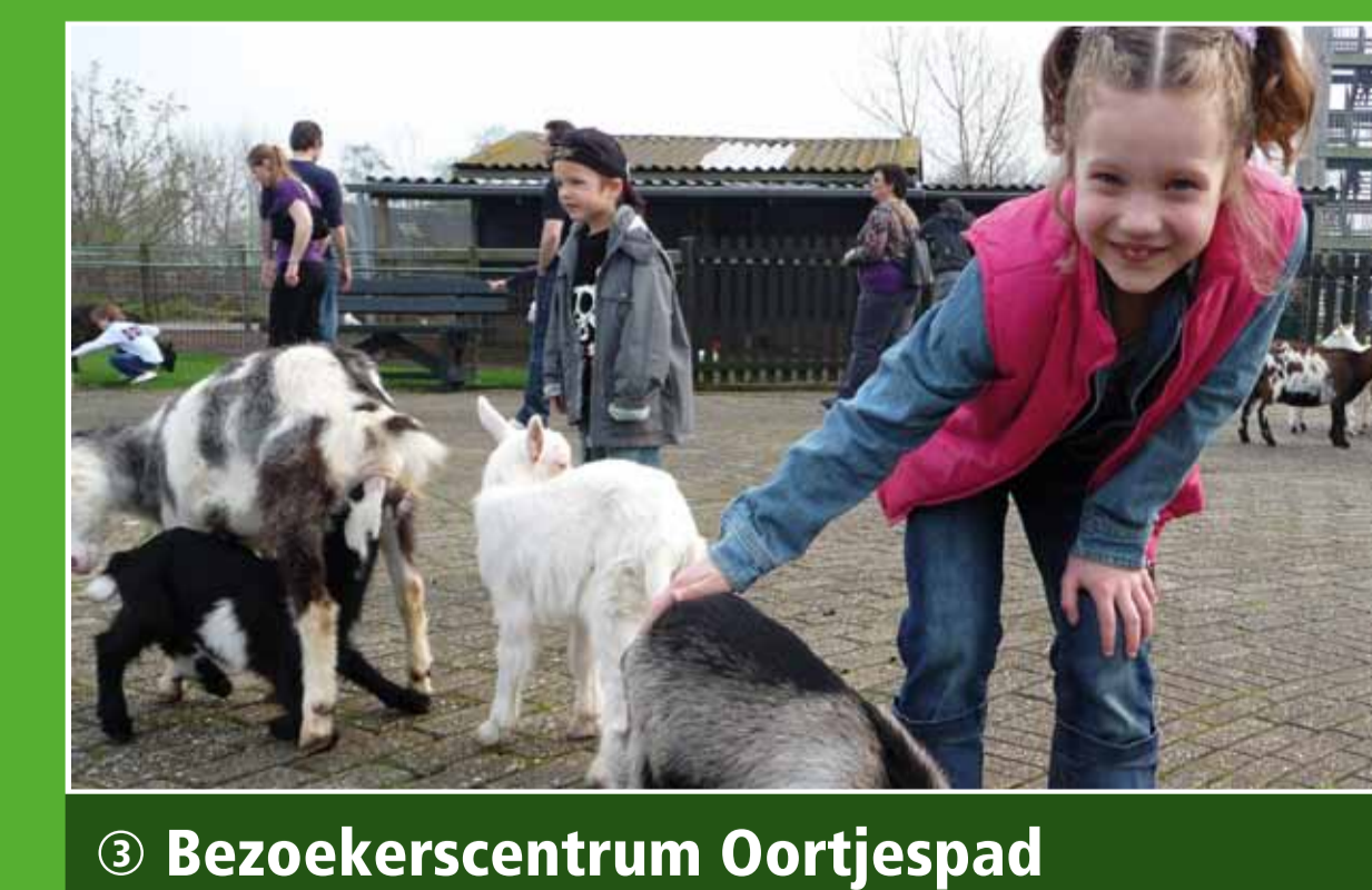
3 Bezoekerscentrum Oortjespad

Rondom de Nieuwkoopse Plassen kunt u heerlijk fietsen en wandelen. Dit bijzondere natuurgebied is een ware oase van rust en ruimte voor plant, dier en mens. Op en rond het water is veel te zien en te beleven, zoals bloemrijke hooilandjes en uitgestrekte rietvelden. Bovendien zijn de Nieuwkoopse Plassen bekend om de vele vogels, waaronder de purperreiger.