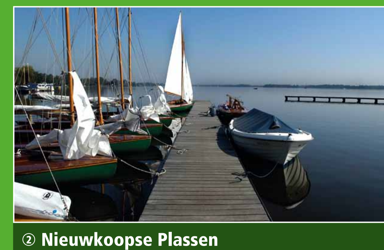
2 Nieuwkoopse Plassen

Kasteel de Haar is het grootste en meest luxueuze kasteel van Nederland. Bezoek het kasteel onder begeleiding van een deskundige gids of maak een stevige wandeling door het uitgestrekte Engelse landschapspark en ontdek met de audiotour bijzondere plekken. Adres: Kasteellaan 1, Haarzuilens. Openingsdagen park; ma t/m zo 9.00-17.00 uur.