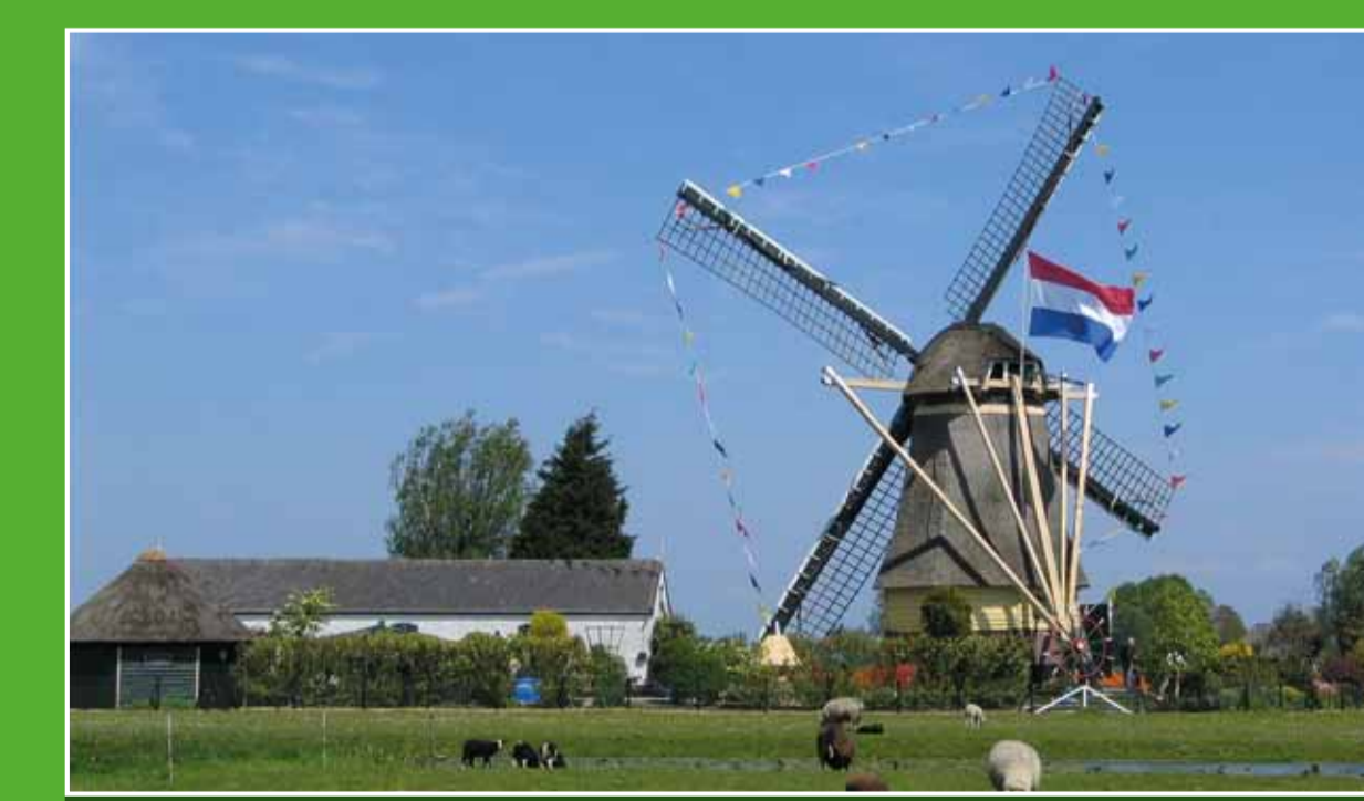
3 De Veenmolen

Het Fort aan de Drecht behoort tot de Stelling van Amsterdam, een 135 kilometer lange verdedigingslinie. Met een ingenieus systeem kon het land rondom de linie onder water worden gezet, waardoor een waterplas kon ontstaan, niet diep genoeg voor schepen en te diep voor man en paard. Tegenwoordig herbergt het Fort o.a. een restaurant en een tentoonstelling in de keelkazemat. Adres: Grevelingen 30-66, Uithoorn. Tentoonstelling toegankelijk do-vr 14.00-16.00 uur en za-zo 12.00-17.00 uur.