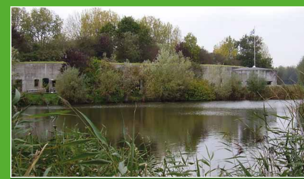
2 Fort aan de Drecht

Direct aan de Nieuwkoopse Plassen ligt het bezoekerscentrum van Natuurmonumenten. U vindt er een interactieve tentoonstelling over de moerasnatuur, grote aquaria met onderwaterleven, een wisselpositie en horeca. Ook is er een uitgebreide winkel met (natuur)producten. Adres: Dorpsstraat 116, Nieuwkoop. Openingsdagen: di t/m zo 10.00-17.00 uur. In nov t/m mrt. alleen wo en vr t/m zo 12.00-17.00 uur.