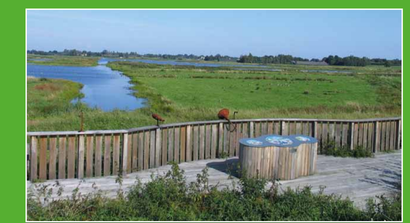
4 De Kromme Mijdrecht & Groene Jonker

In het dorp Wilnis vindt u De Veenmolen, een grondzeiler uit 1823. De molen doet dienst als korenmolen en wordt in stand gehouden door vrijwilligers. Op zaterdag wordt het meel verkocht in de molenwinkel. Adres: Oudhulperweg 109, Wilnis. Openingsdagen: za 10.00-16.00 uur.