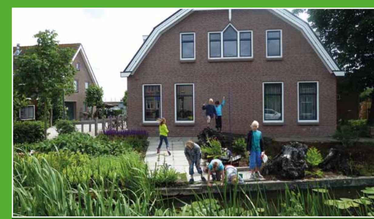
1 Bezoekerscentrum Nieuwkoopse Plassen

Direct aan de Nieuwkoopse Plassen ligt het bezoekerscentrum van Natuurmonumenten. U vindt er een interactieve tentoonstelling over de moerasnatuur, grote aquaria met onderwaterleven, een wisselpositie en horeca. Ook is er een uitgebreide winkel met (natuur)producten. Adres: Dorpsstraat 116, Nieuwkoop. Openingsdagen: di t/m zo 10.00-17.00 uur. In nov t/m mrt. alleen wo en vr t/m zo 12.00-17.00 uur.