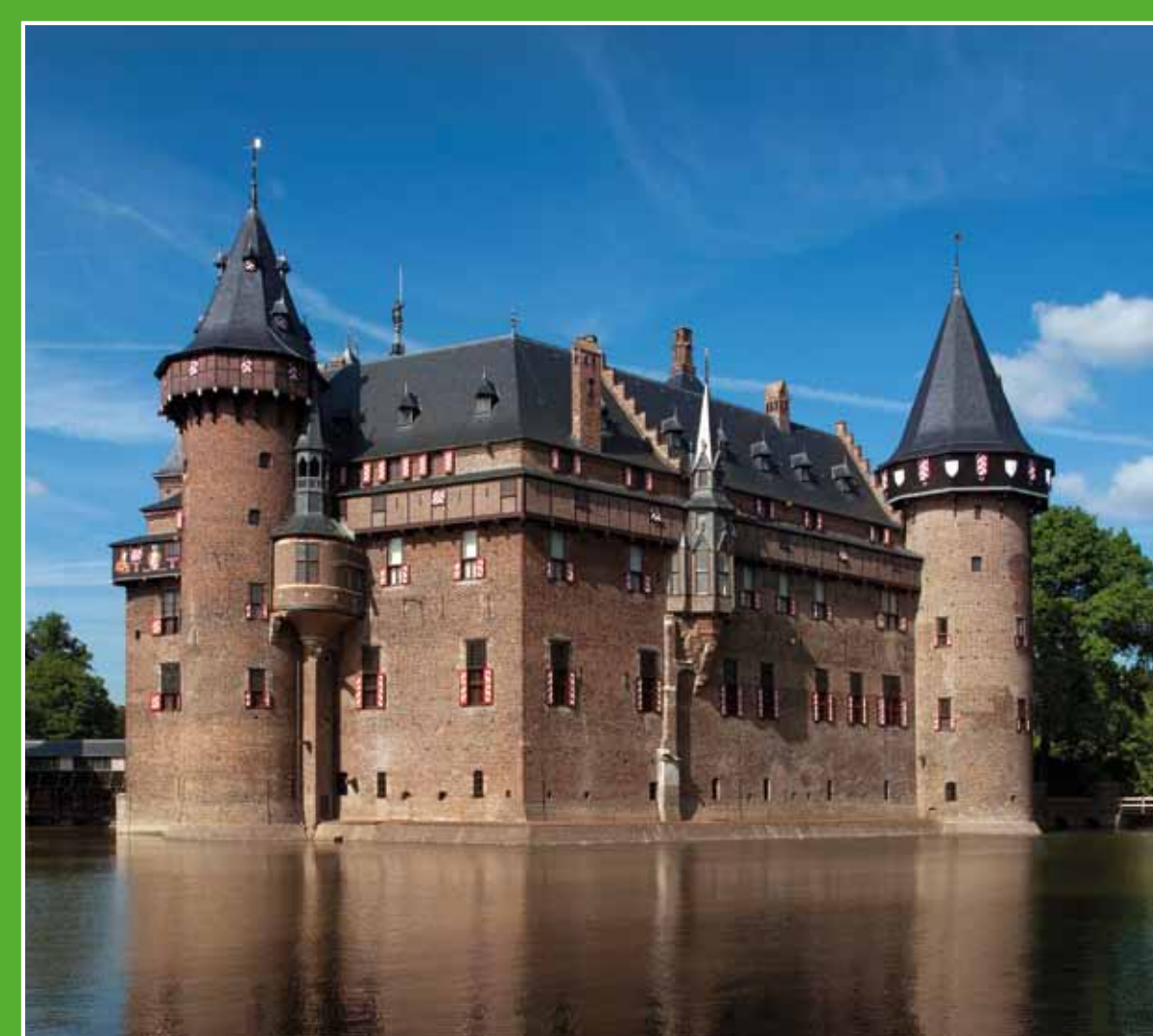
1 Kasteel de Haar

Het Groene Hart ligt voor het grootste deel onder de zeespiegel. Momenteel bevindt u zich op 1,70 meter onder NAP (Normaal Amsterdams Peil).