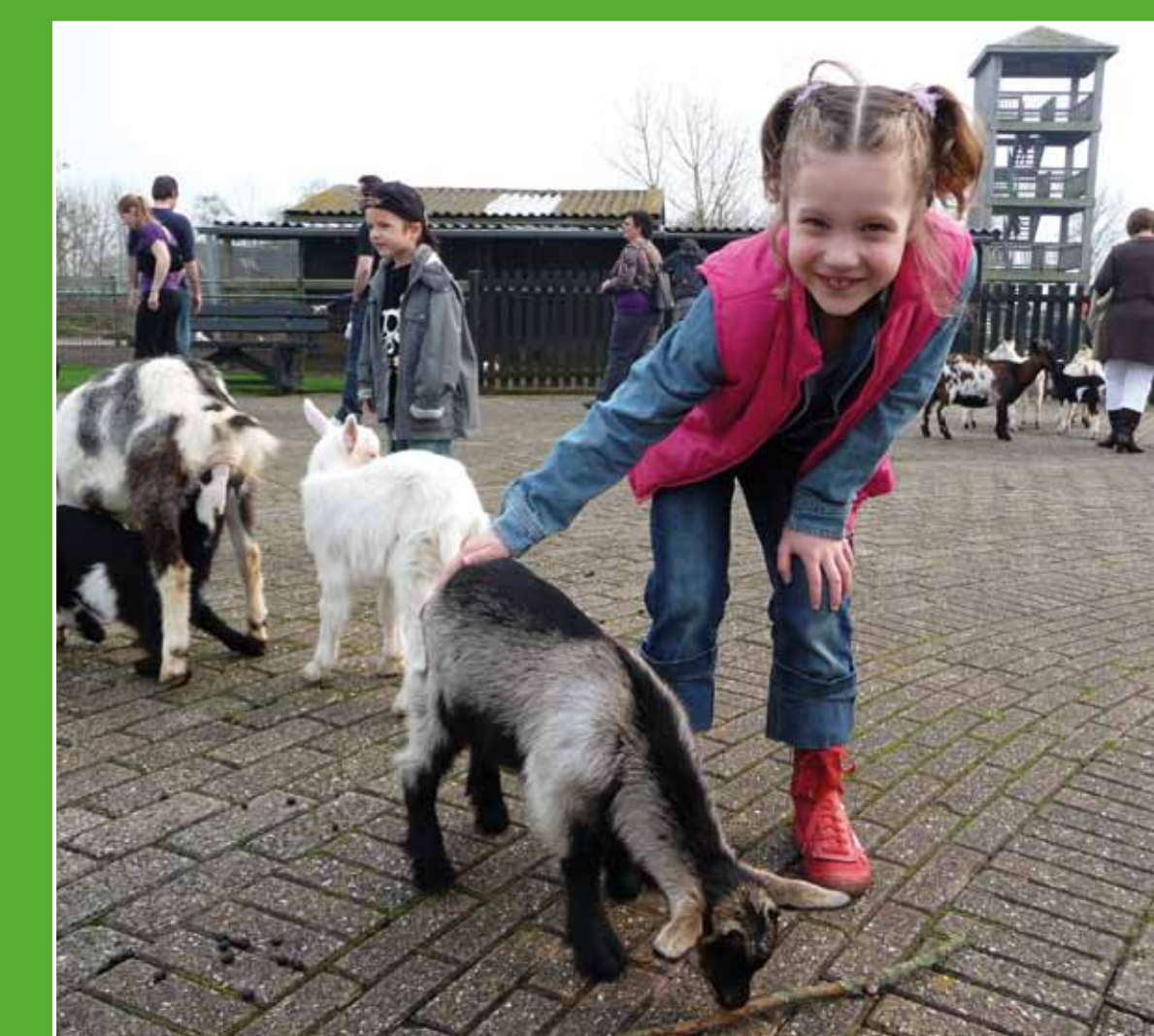
3 Bezoekerscentrum Oortjespad

Rondom de Nieuwkoopse Plassen kunt u heerlijk fietsen en wandelen. Dit bijzondere natuurgebied is een ware oase van rust en ruimte voor plant, dier en mens. Op en rond het water is veel te zien en te beleven, zoals bloemrijke hooilandjes en uitgestrekte rietvelden. Bovendien zijn de Nieuwkoopse Plassen bekend om de vele vogels, waaronder de purperreiger.