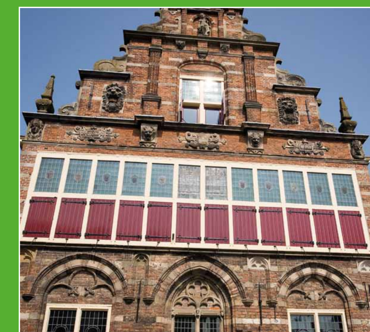
4 Stadsmuseum Woerden

Informatie over het gebied 'De Venen' vindt u in het Bezoekerscentrum Oortjespad, direct bij de TOP. Voor kinderen valt er veel te beleven en ontdekken. De vaste tentoonstelling geeft antwoord op vragen zoals welke dieren in de sloot leven en welke weidevogels je hoort. Naast het bezoekerscentrum ligt een kinderboerderij.