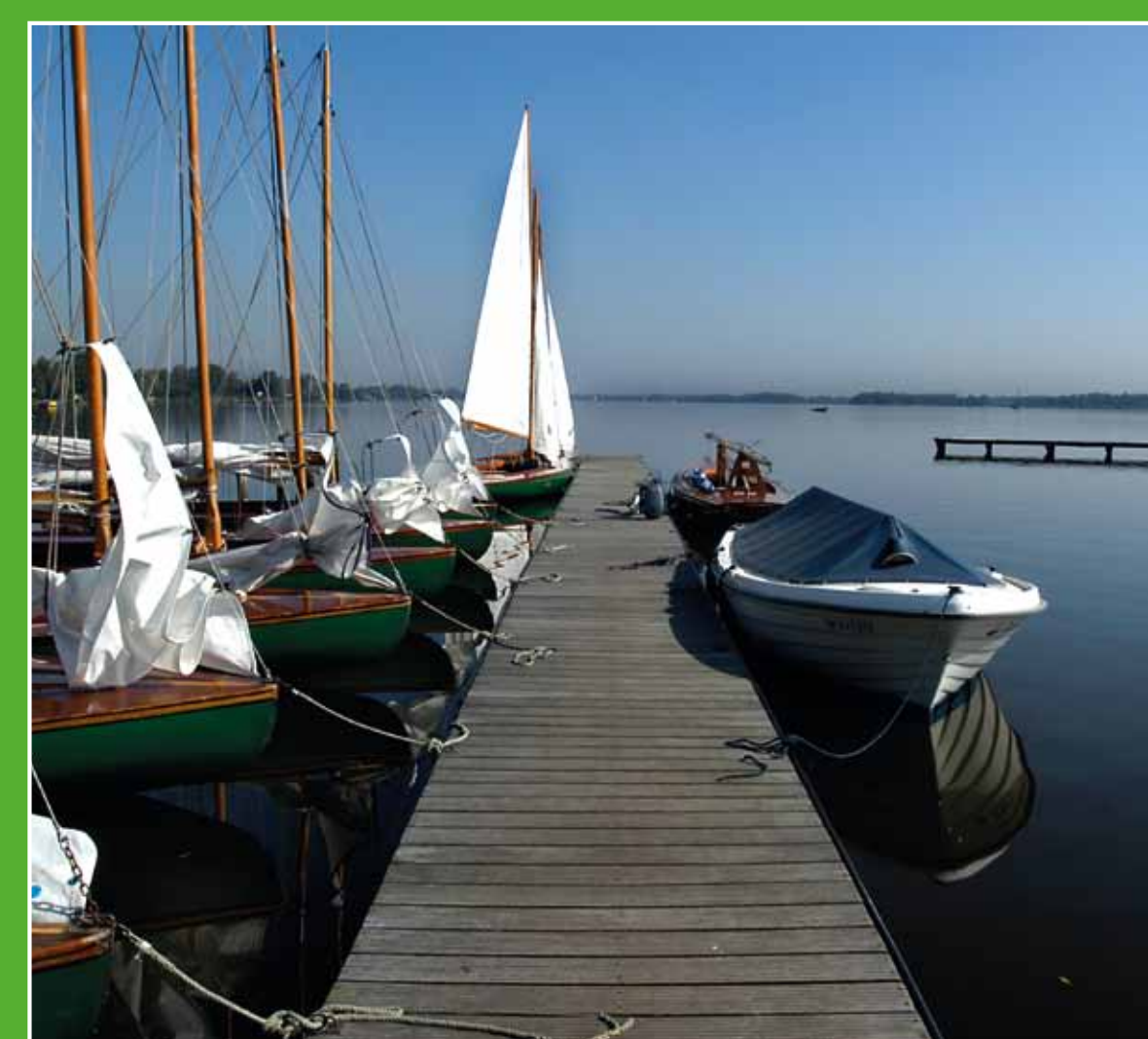
2 Nieuwkoopse Plassen

Kasteel de Haar is het grootste en meest luxueuze kasteel van Nederland. Bezoek het kasteel onder begeleiding van een deskundige gids of maak een stevige wandeling door het uitgestrekte Engelse landschapspark en ontdek met de audiotour bijzondere plekken. Adres: Kasteellaan 1, Haarzuilens. Openingstijden park: ma t/m zo 9.00-17.00 uur.