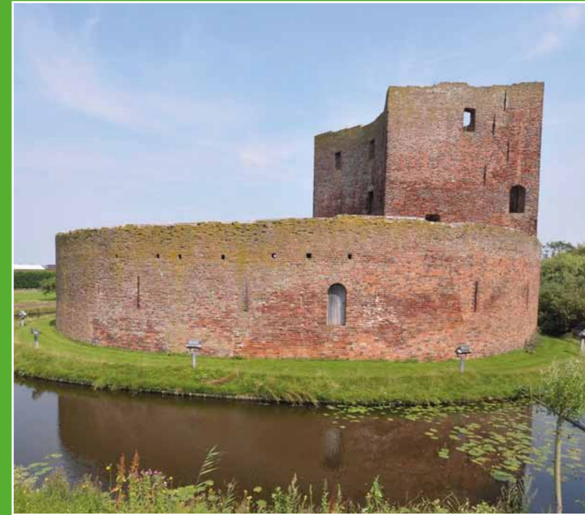
① Ruïne van Teylingen

In de omgeving is veel te zien en te beleven. Wandel- en fietsroutes voeren u naar de mooiste plekjes en laten u kennis maken met het schitterende plessengebied, de prachtige natuur, de historische burcht, het gezellige centrum van Sassenheim en de authentieke straatjes van Warmond. In het voorjaar geniet u van de uitgestrekte bollenvelden die dan in volle bloei staan. In april rijdt het jaarlijkse Bloemencorso van de Bollenstreek door Voorhout en Sassenheim. In de zomer bieden de Kagerplassen volop mogelijkheden voor (water)recreatie.