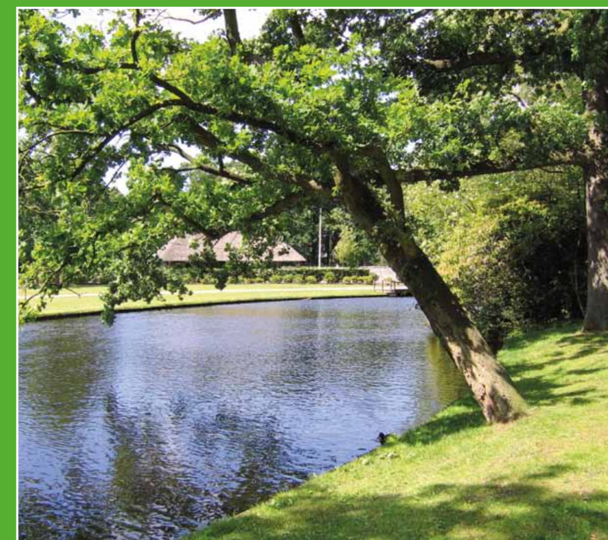
④ Park Rusthoff

Het Boerhaavehuis is het geboortehuis van de beroemde medicus en botanicus Herman Boerhaave (geboren in 1668). Tegenwoordig is het huis in gebruik als pastorie. De mooi aangelegde tuin en kruidentuin zijn dagelijks en gratis opengesteld voor bezoekers. Adres: Kerkweg 11 in Voorhout.