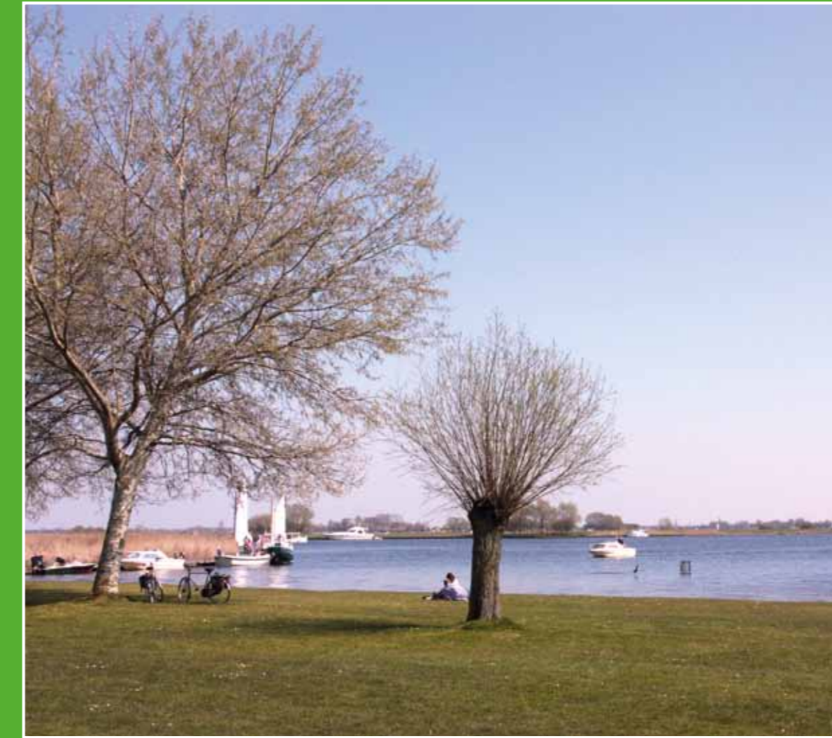
② Recreatie-eiland Koudenhoorn

De ruïne van Teylingen is een ringburcht met een woontoren. Ooit hoorde hier ook een voorburcht en poortgebouw bij, maar hier is niets meer van over. De bekendste bewoner van het slot is Jacoba van Beieren (1433). Zij was afkomstig uit de hoogste adellijke kringen. De ruïne is toegankelijk voor publiek. Adres: Teylingerlaan 15, Voorhout.