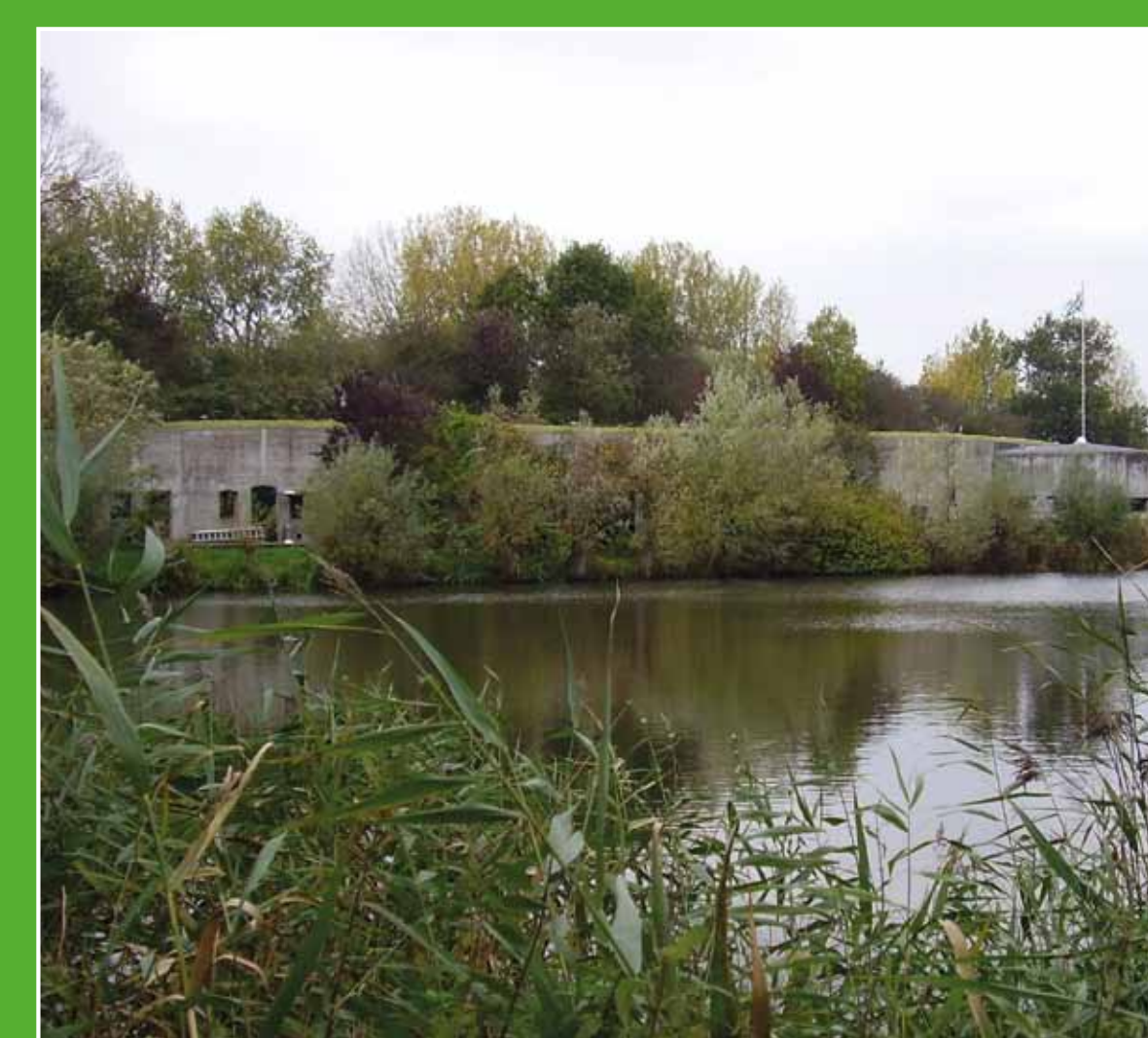
2 Fort aan de Drecht

Direct aan de Nieuwkoopse Plassen ligt het bezoekerscentrum van Natuurmonumenten. U vindt er een interactieve tentoonstelling over de moerasnatuur, grote aquaria met onderwaterleven, een wisselpositie en horeca. Ook is er een uitgebreide winkel met (natuur)producten. Adres: Dorpsstraat 116, Nieuwkoop. Openingsdagen: di t/m zo 10.00-17.00 uur. In nov. t/m mrt. alleen wo en vr t/m zo 12.00-17.00 uur.