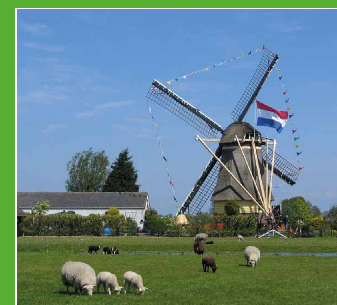
3 De Veenmolen

Het Fort aan de Drecht behoort tot de Stelling van Amsterdam, een 135 kilometer lange verdedigingslinie. Met een ingenieus systeem kon het land rondom de linie onder water worden gezet, waardoor een waterplas kon ontstaan, niet diep genoeg voor schepen en te diep voor man en paard. Tegenwoordig herbergt het Fort o.a. een restaurant en een tentoonstelling in de keelkazemat. Adres: Grevelingen 30-66, Uithoorn. Tentoonstelling toegankelijk do-vr 14.00-16.00 uur en za-zo 12.00-17.00 uur.