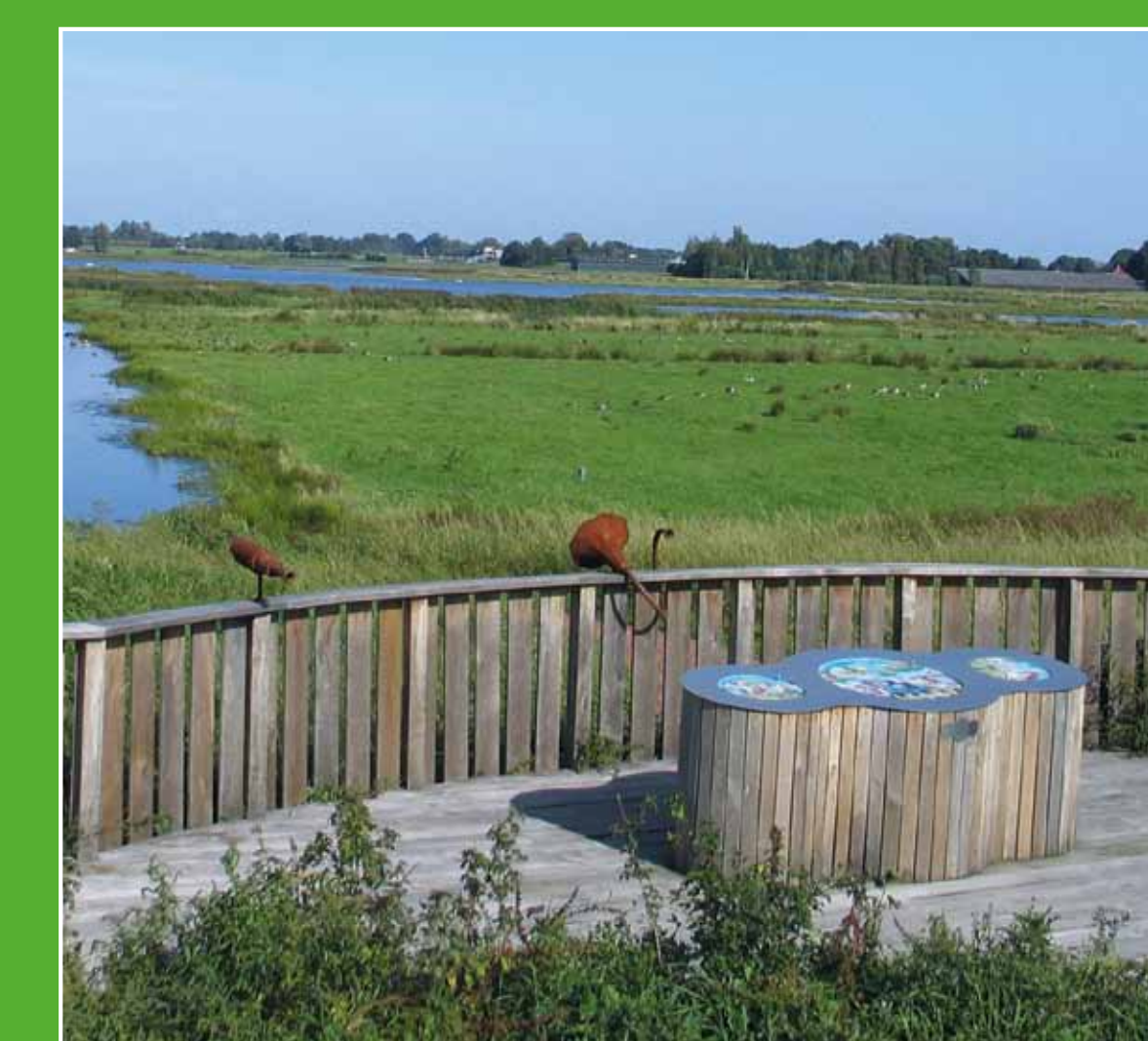
4 De Kromme Mijdrecht & Groene Jonker

In het dorp Wilnis vindt u De Veenmolen, een grondzeiler uit 1823. De molen doet dienst als korenmolen en wordt in stand gehouden door vrijwilligers. Op zaterdag wordt het meel verkocht in de molenvinkel. Adres: Oudhuyzerweg 109, Wilnis. Openingsdagen: za 10.00-16.00 uur.