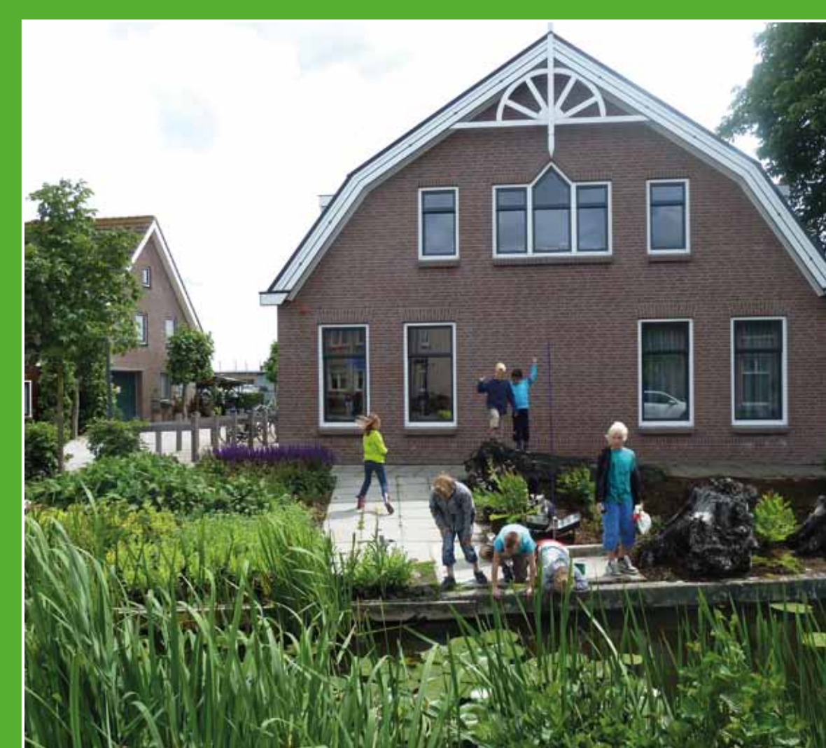
1 Bezoekerscentrum Nieuwkoopse Plassen

Het Groene Hart ligt voor het grootste deel onder de zeespiegel. Momenteel bevindt u zich op 1,38 meter onder NAP (Normaal Amsterdams Peil).