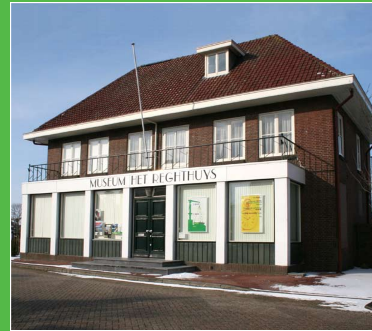
② Museum Het Reghthuys

In Giessenburg zijn diverse sfeervolle winkels te vinden op een unieke locatie. In de historische winkelstraatjes 'De Graanshuur' en 'De Kolenbeurs' zijn winkels gevestigd met een eigentijds aanbod op het gebied van countryliving en lifestyle. De gevels zijn op authentieke wijze opgetrokken uit oude bouwmaterialen. Adres: Doetseweg 43-51, Giessenburg. Openingstijden: do-za 10.00-17.00 uur.