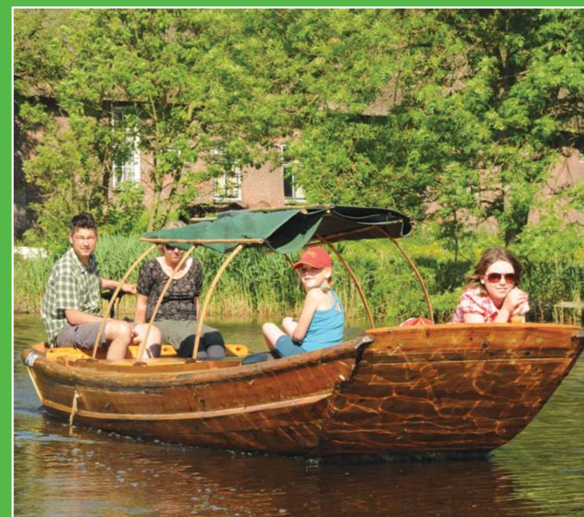
③ Natuurtuin en botenverhuur

Cultuurhistorisch museum Het Reghthuys in Giessenburg heeft een stijlkamer, ambachtenkamer, boerenkamer, oranje- en oorlogshoek. Daarnaast zijn er veel archeologische vondsten te bewonderen en is er altijd een bijzondere wissel-expositie. Adres: Dorpsstraat 10, Giessenburg. Openingstijden: 0184-652 872 of 0184-651 577.