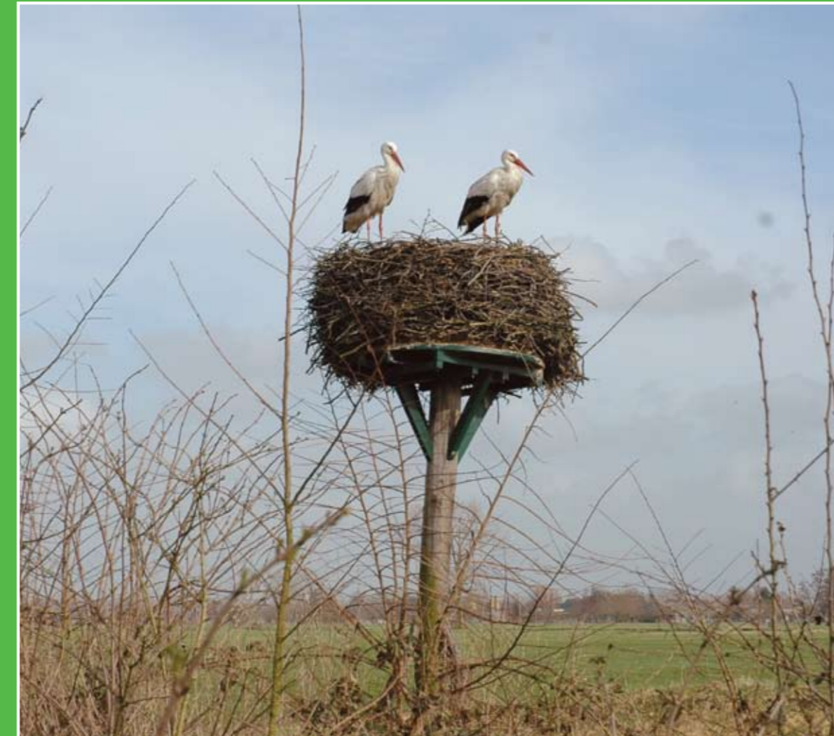
① Ooievaardorp Het Liesvelt

Landelijk gelegen tussen Groot-Ammers en Nieuwpoort ligt 'Het Liesvelt'. Dit streekcentrum heeft een bijenstal, boerenspeeltuin, rietmoeras, griendeiland, eendenkooi en een molen. Er worden ook wisselende tentoonstellingen georganiseerd. Elk voorjaar worden de nesten bij het streekcentrum bezet door ooievaars. Adres: Wilgenweg 3, Groot-Ammers.