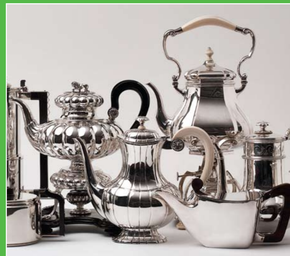
③ Ned. Goud-, Zilver- en Klokkemuseum

Even op adem komen met uitzicht op een typisch Hollands landschap? Theetuin De Winde is een mooie plek om onder het genot van een kopje koffie of thee en een zelfgebakken appelpunt het mooie landschap op u in te laten werken. Adres: Achterland 4, Groot-Ammers.