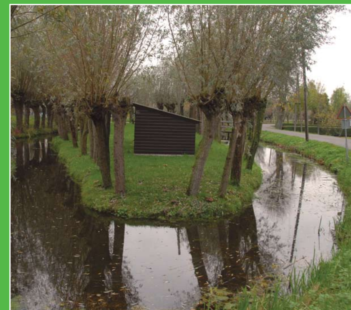
④ De Vlist

Dit museum toont een prachtige verzameling zilver, goud en klokken die dateren uit 1600 en later. Prachtige serviezen, kandelaars, horloges en wandklokken maken deel uit van de collectie. Het museum is gevestigd in het voormalige, 17e-eeuwse Arsenaal. Het staat midden in het historische centrum van de Zilverstad van Nederland. Adres: Kazerneplein 4, Schoonhoven.