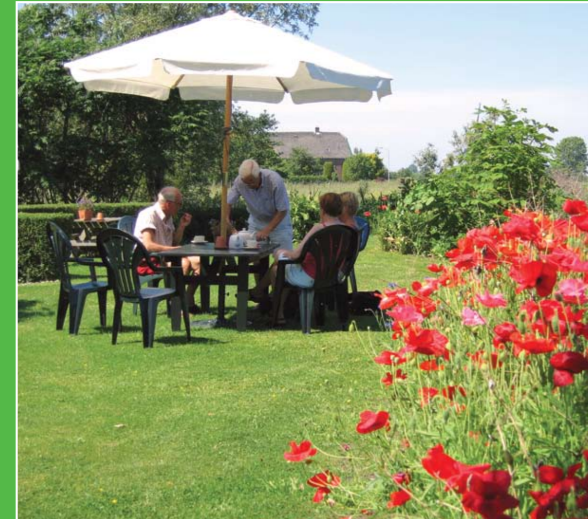
② Theetuin De Winde

Landelijk gelegen tussen Groot-Ammers en Nieuwpoort ligt 'Het Liesvelt'. Dit streekcentrum heeft een bijenstal, boerenspeeltuin, rietmoeras, griendeiland, eendenkooi en een molen. Er worden ook wisselende tentoonstellingen georganiseerd. Elk voorjaar worden de nesten bij het streekcentrum bezet door ooievaars. Adres: Wilgenweg 3, Groot-Ammers.