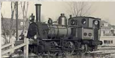
Locomotief de Bello

Route: Mijdrecht - Wilnis - Vinkeveen - Baambrugge - Abcoude (19 km, ongeveer 5 uur wandelen, deels op onverharde weg).