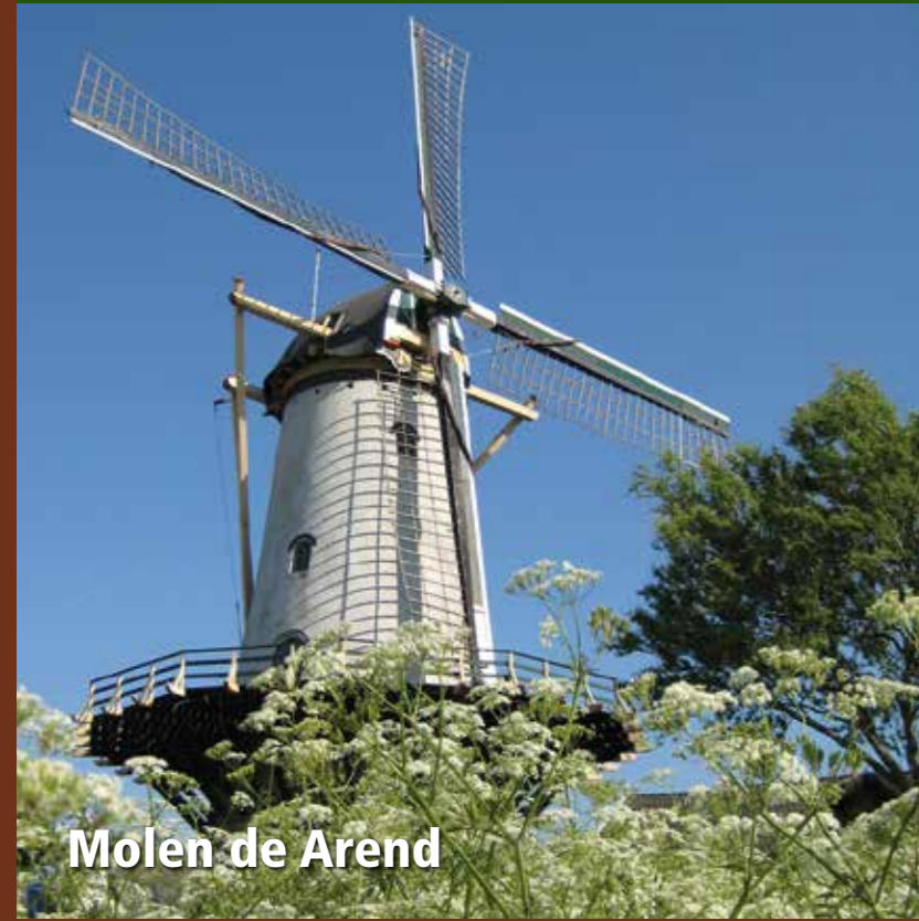
Molen de Arend