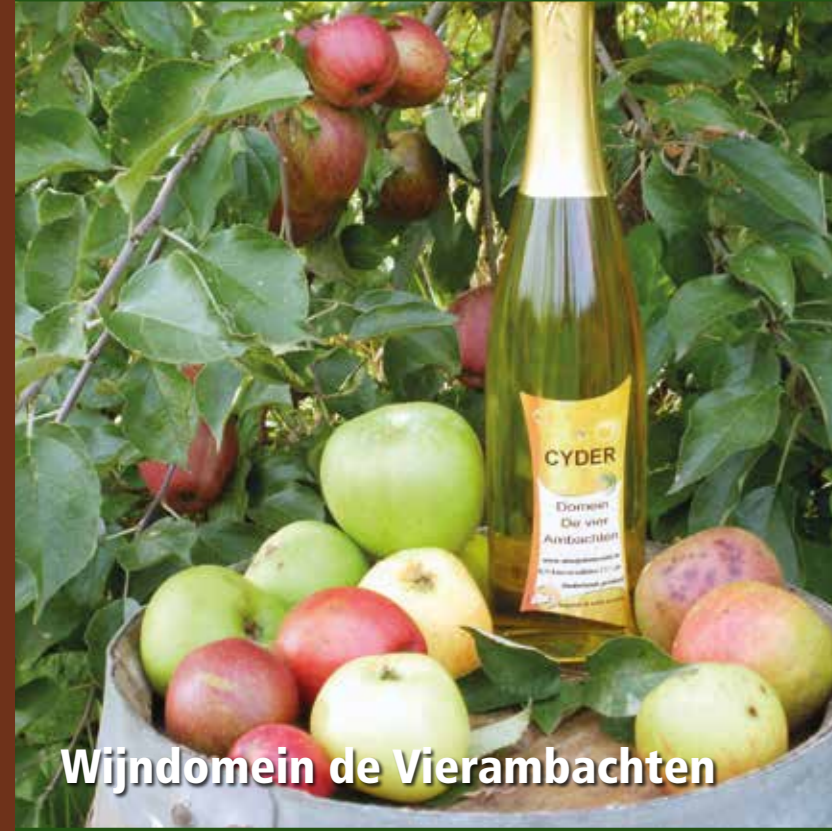
Wijndomein de Vierambachten