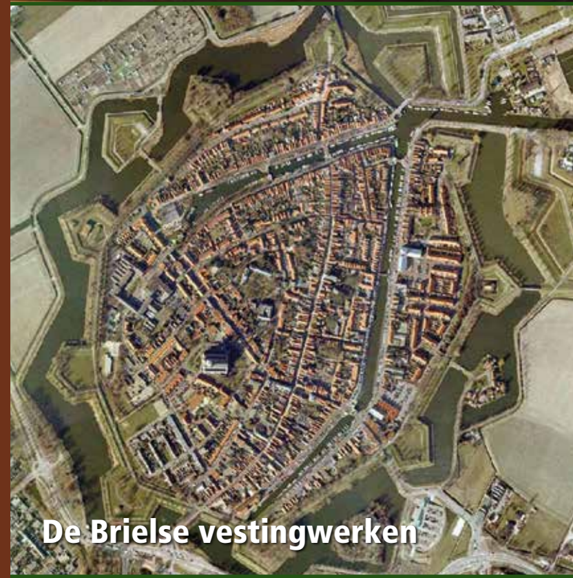
De Brielse vestingwerken