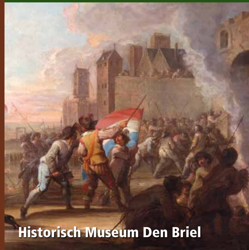
Historisch Museum Den Briel