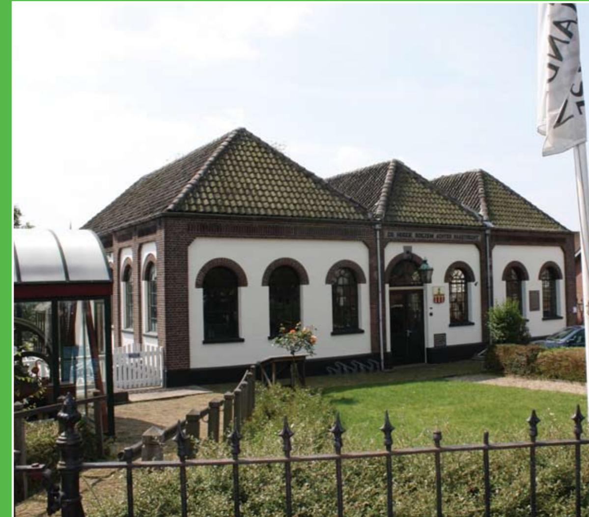
① Poldermuseum Gemaal De Hooge Boezem

In Poldermuseum Gemaal De Hooge Boezem in Haastrecht beleeft u 1000 jaar watergeschiedenis. Een diageluidshow, de expositie "Water, vroeger, nu en later" en draaiende machines in de oude pomruimte onthullen het waterverleden van de streek. Adres: Hoogstraat 31, Haastrecht. Openingstijden: april-sept. ma-vr 12.00-15.00 uur, za 11.00-15.00 uur.