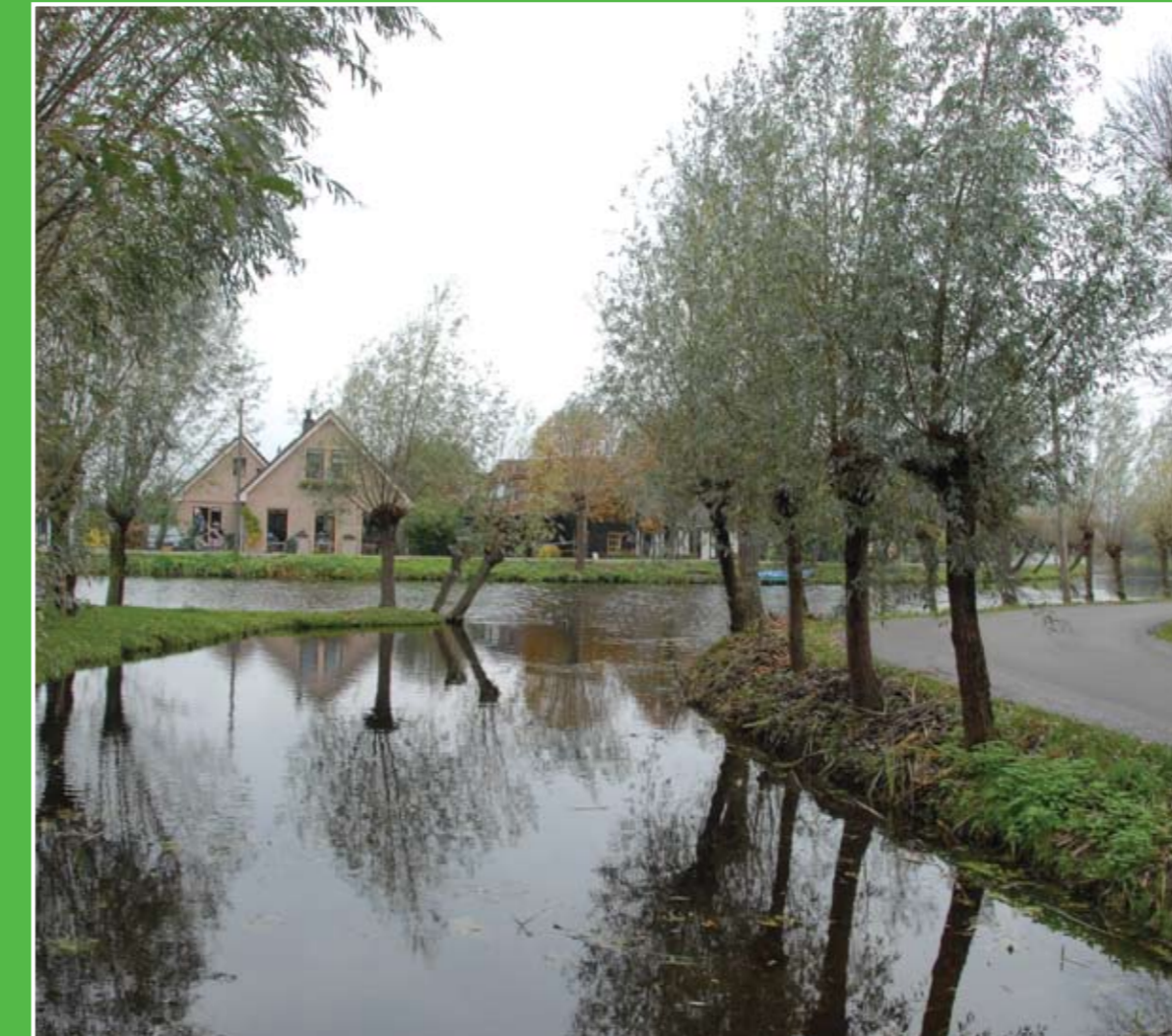
② De Vlist

In Poldermuseum Gemaal De Hooge Boezem in Haastrecht beleeft u 1000 jaar watergeschiedenis. Een diageluidshow, de expositie "Water, vroeger, nu en later" en draaiende machines in de oude pomruimte onthullen het waterverleden van de streek. Adres: Hoogstraat 31, Haastrecht. Openingstijden: april-sept. ma-vr 12.00-15.00 uur, za 11.00-15.00 uur.