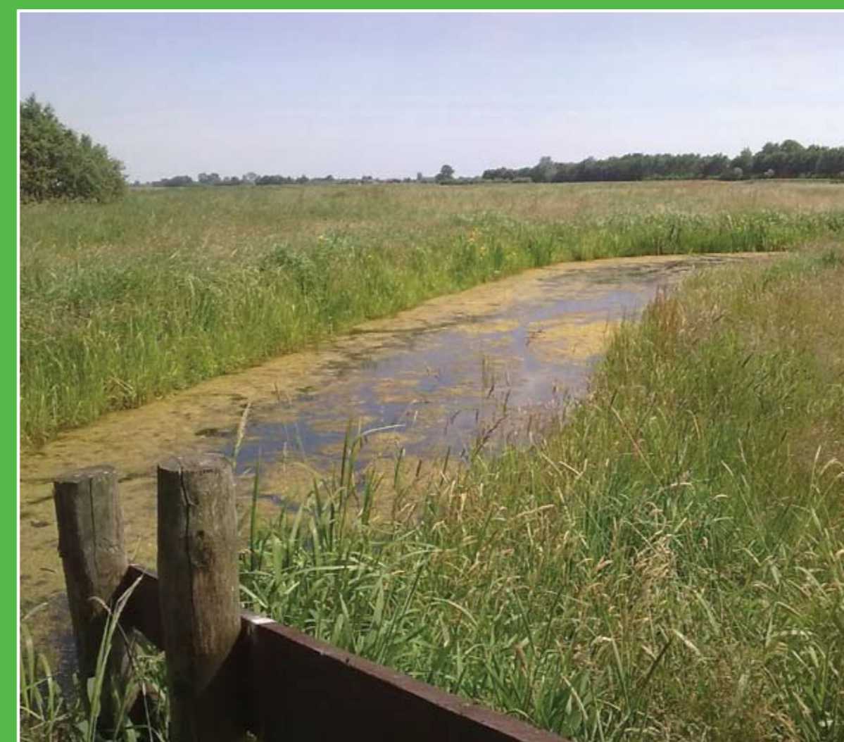
③ Natuurgebied Bilwijk

De Vlist is een veenriviertje dat vroeger werd gebruikt als boezem voor de polders en voor transport van goederen. Het is hier prachtig fietsen en wandelen langs karakteristieke boerderijen en molens, zoals Molen de Bachtenaar en Molen Bonrepas. Bij Kanocentrum Haastrecht kunt u kano's en fietsen huren. Adres: Hoogstraat 10, Haastrecht. Openingstijden: april-sept. di-za 10.00-17.00 uur.