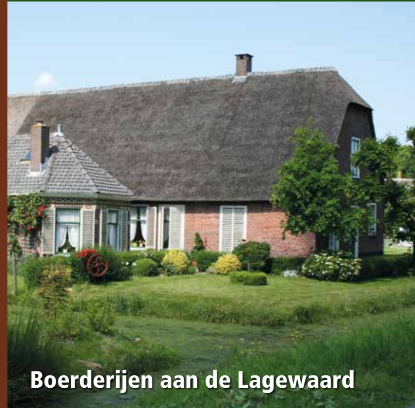
Boerderijen aan de Lagewaard