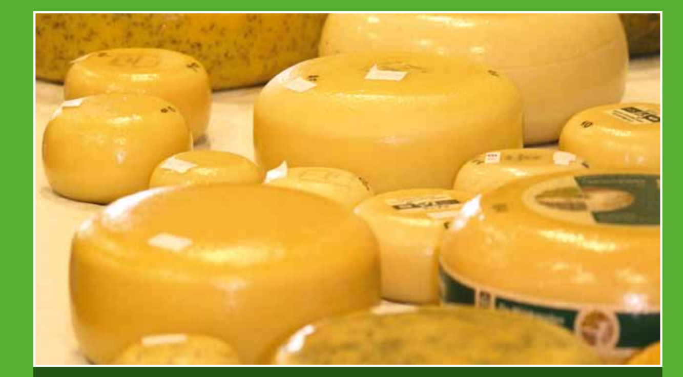
4 Kaas- en Zuivelboerderij Van der Arend

Rondom de Nieuwkoopse Plassen kunt u heerlijk fietsen en wandelen. Dit bijzondere natuurgebied is een ware oase van rust en ruimte voor plant, dier en mens. Op en rond het water is veel te zien en te beleven, zoals bloemrijke hooilandjes en uitgestrekte rietvelden. Bovendien zijn de Nieuwkoopse Plassen bekend om de vele vogels, waaronder de purperreiger.