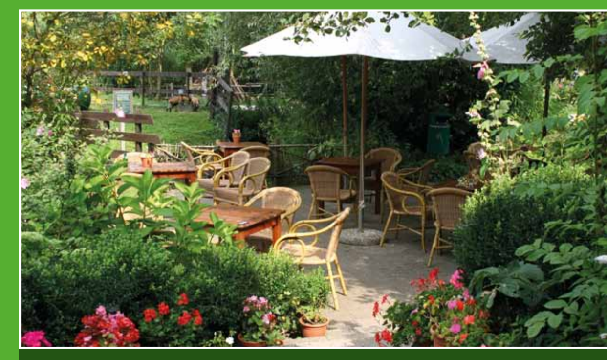
1 Boerderij Amstelkade

Aan de rivier de Kromme Mijdrecht ligt Boerderij Amstelkade, een plek waar mensen met een verstandelijke beperking werken. In het theehuis geniet u van een kopje koffie of een broodje. Kinderen kunnen kennismaken met de dieren van de kinderboerderij. Verder worden er kano's, bootjes en fietsen verhuurd. Adres: Amstelkade 61, Wilnis. Openingsdagen: ma t/m vr 10.00-15.30 uur, za en zo 10.30-16.30 uur, 1 okt. t/m 1 apr.: op za gesloten.