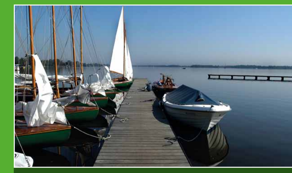
3 Nieuwkoopse Plassen

In het dorp Wilnis vindt u De Veenmolen, een grondzeiler uit 1823. De molen doet dienst als korenmolen en wordt in stand gehouden door vrijwilligers. Op zaterdag wordt het meel verkocht in de molenvinkel. Adres: Oudhulzerweg 109, Wilnis. Openingsdagen: za 10.00-16.00 uur.