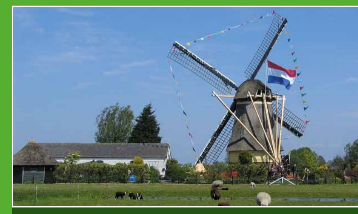
2 De Veenmolen

Aan de rivier de Kromme Mijdrecht ligt Boerderij Amstelkade, een plek waar mensen met een verstandelijke beperking werken. In het theehuis geniet u van een kopje koffie of een broodje. Kinderen kunnen kennismaken met de dieren van de kinderboerderij. Verder worden er kano's, bootjes en fietsen verhuurd. Adres: Amstelkade 61, Wilnis. Openingsdagen: ma t/m vr 10.00-15.30 uur, za en zo 10.30-16.30 uur, 1 okt. t/m 1 apr.: op za gesloten.