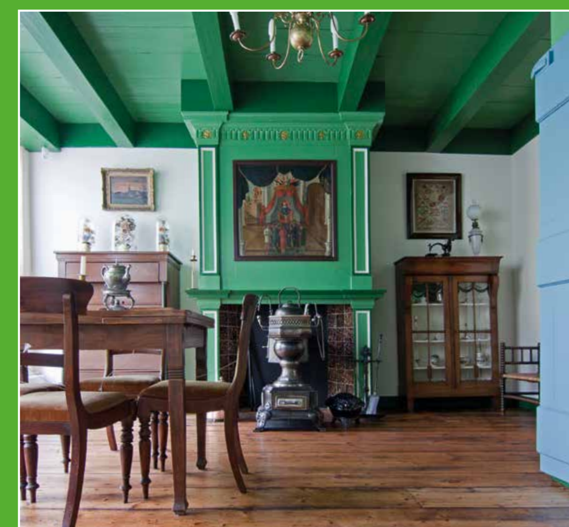
3 Museum Hoeksche Waard