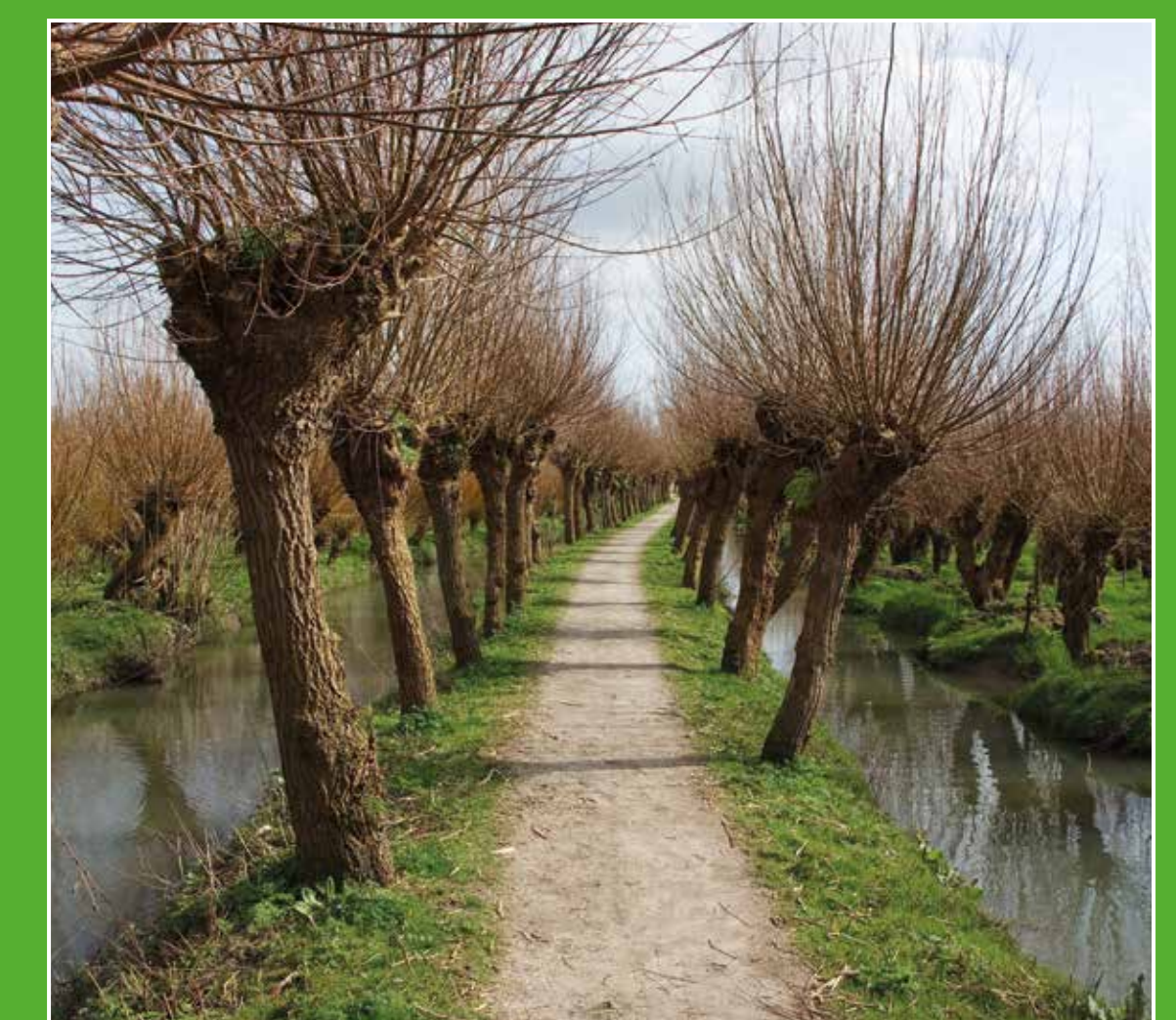
4 Rhoonse en Carnisse Grienden