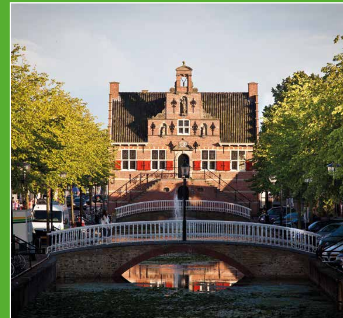
1 Historisch centrum Oud-Beijerland