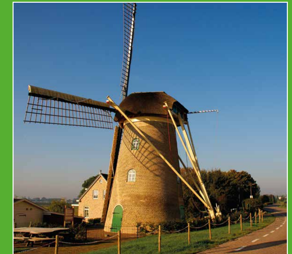
2 Molen Goidschalchoort