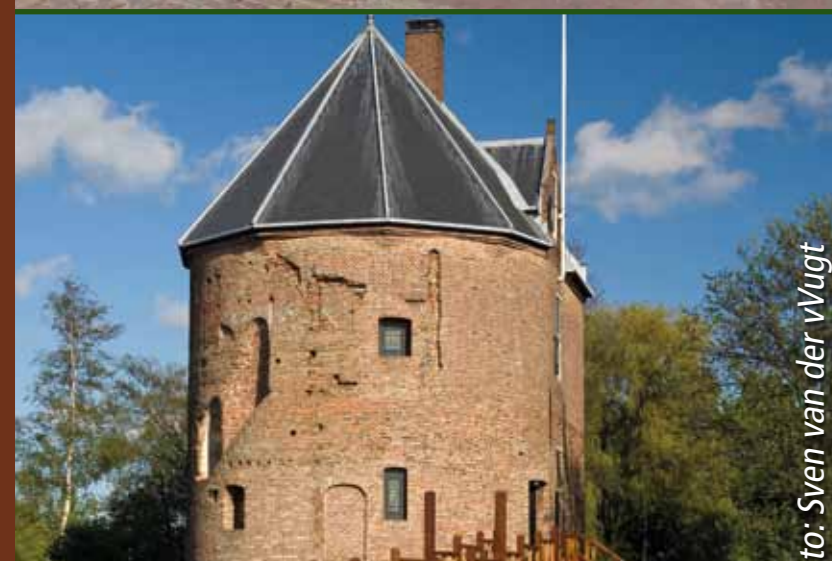
't Huys van Dever