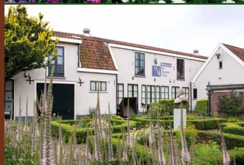
Museum De Zwarte Tulp