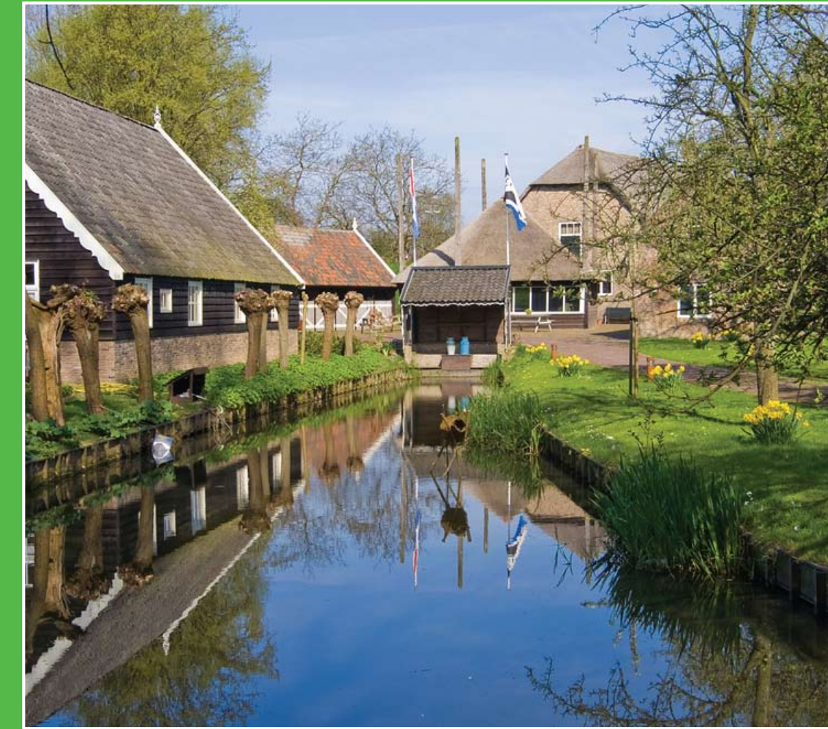
② Streekmuseum Crimpenerhof (9 km)

Langs de groene oevers van De Loet is het prachtig wandelen of fietsen. Er lopen verschillende wandel- en fietspaden, met prachtig uitzicht op het water en het achterliggende veenweidelandschap. Ook is het gebied bij uitstek geschikt voor een kanotocht. Er zijn kano's te huur bij het kanocentrum. Adres: Loet 4, Lekkerkerk.