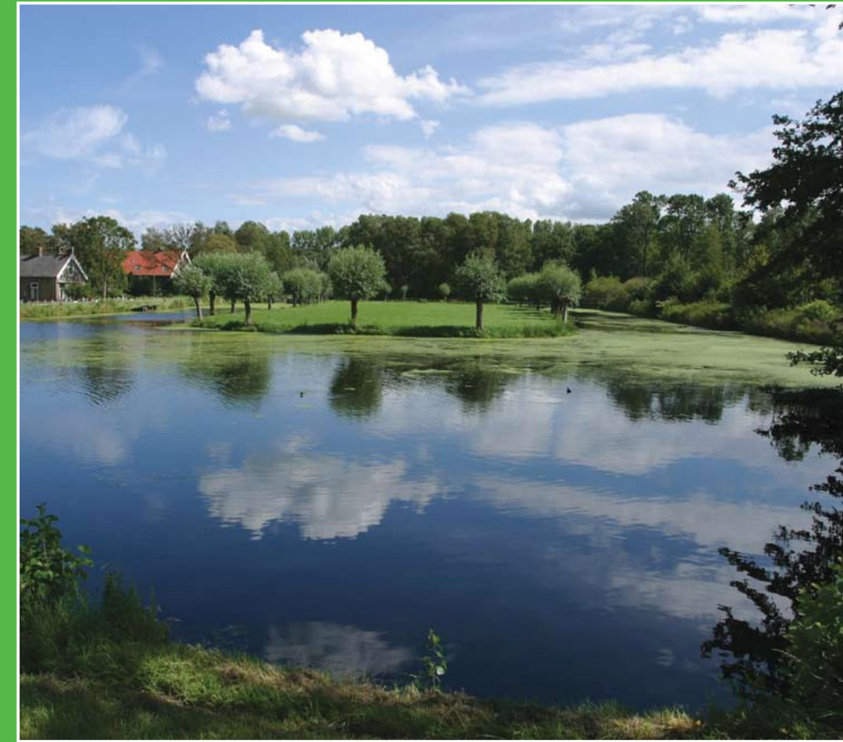
① De Loet

Het veenriviertje De Loet heeft prachtige groene oevers en heeft het omliggende bos haar naam gegeven. Planten en dieren kunnen zich in het gebied in alle rust ontwikkelen. In het voorjaar en de zomer is overal koolzaad, fluitenkruid, riet en orchis te zien.