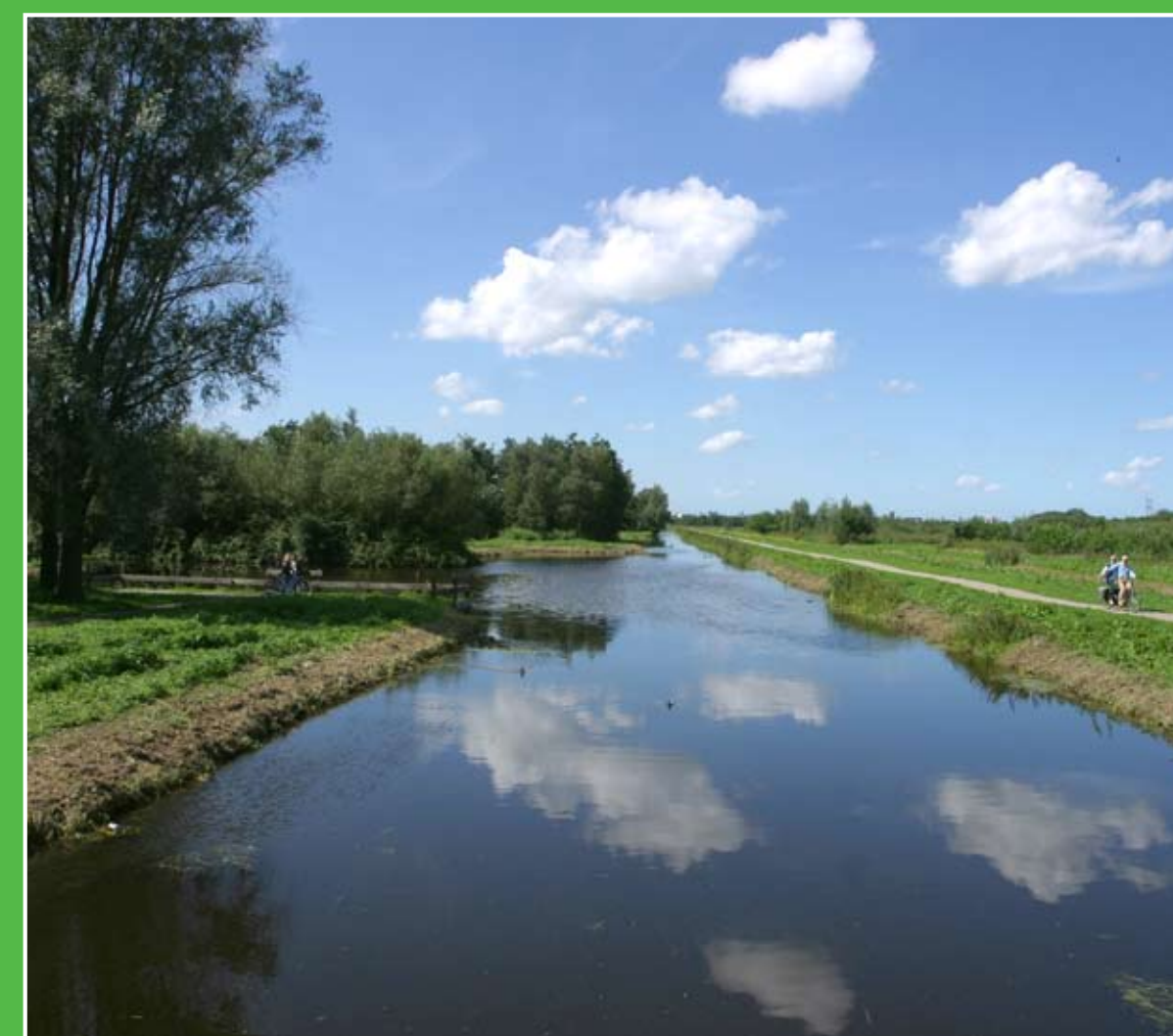
③ Recreatiegebied Krimpenerhout (6 km)

Streekmuseum Crimpenerhof is gevestigd in een zeventiende-eeuwse boerderij, gelegen op een fraai boerenerf. U krijgt hier een indruk van de wijze waarop men in de Krimpenerwaard gedurende de negentiende en het begin van de twintigste eeuw woonde en werkte. Adres: IJsseldijk 312, Krimpen aan den IJssel. Openingstijden: di-za 14.00-17.00 uur.