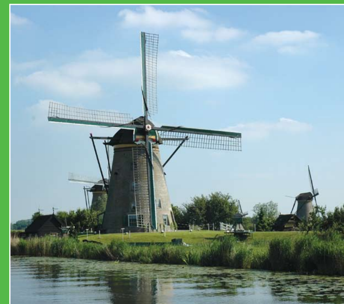
④ Werelderfgoed Kinderdijk (8 km)

De Krimpenerhout is een jong recreatiegebied in Krimpen aan de Lek aan de rand van Krimpen aan den IJssel. Het gebied is afwisselend, met een recreatieplas waar in de zomer volop gerecreëerd wordt. Ook zijn er moerasachtige gedeeltes. In het zogenaamde koiënbos wordt geëxperimenteerd met spontane bosontwikkeling.