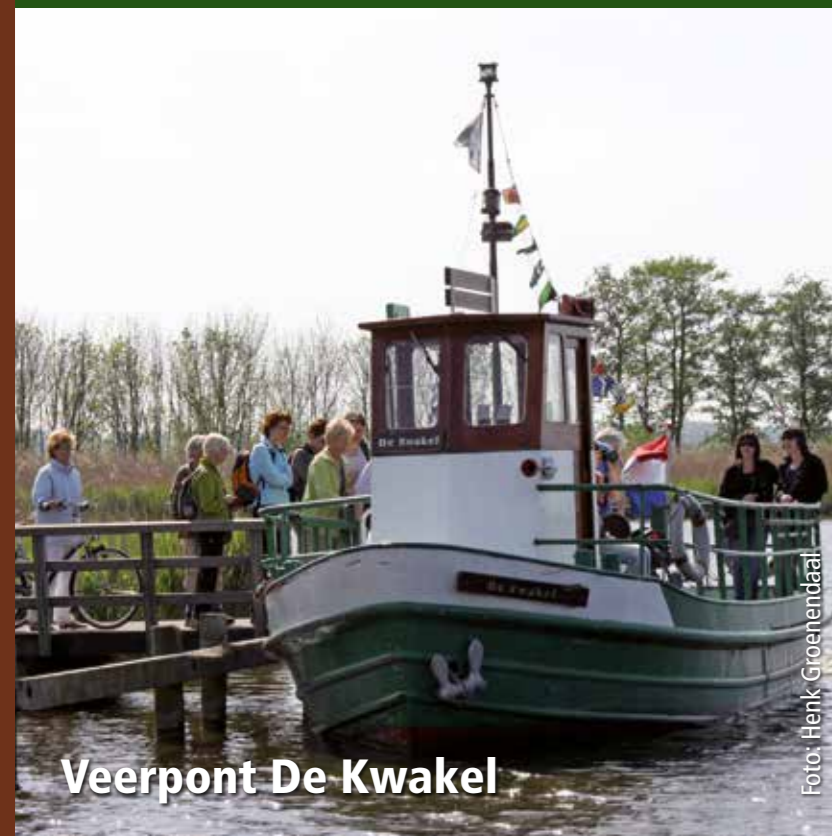
Veerpont De Kwakel