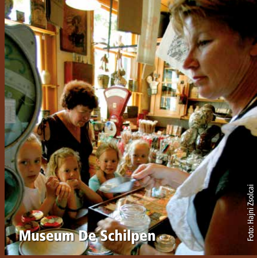
Museum De Schilpen