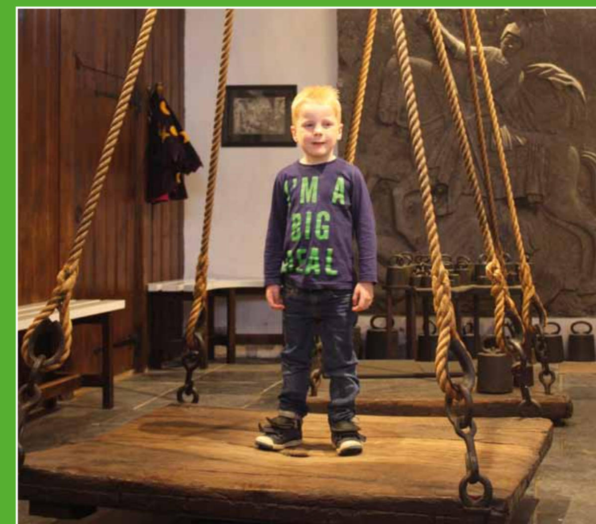
④ Museum de Heksenwaag

Korenmolen De Windotter is een stenen stellingmolen uit 1732. De molen staat op de oude stadsmuur van IJsselstein. Je kunt hier de molenaar nog op ambachtelijke wijze aan het werk te zien. Per week wordt er meer dan 8000 kilo meel gemalen! De fraaie molenwinkel heeft het grootste assortiment meelproducten in Nederland, die in kleine verpakking voor de thuisbakker te koop zijn. Adres: Walkade 73, IJsselstein. Telefoon: 030-6888881. Internet: www.windotter.nl