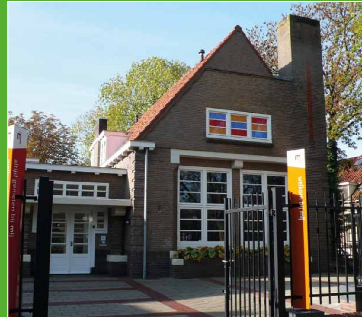
① mij | museumijsselstein en kasteeltoren

mij | museumijsselstein is een huis vol verhalen over ridders en kastelen, over hedendaagse vormgeving en oude ambachten, over actuele kunsten en eeuwenoude schilderijen. Een stukje oude historie van IJsselstein kunt u zelf ervaren bij de kasteeltoren; gelegen op 5 minuten loopafstand van het museum. Adres museum: Walkade 2, IJsselstein. Adres kasteeltoren: Kronenburgplantsoen 9, IJsselstein. Telefoon museum: 030-6886800. Internet: www.museumijsselstein.nl