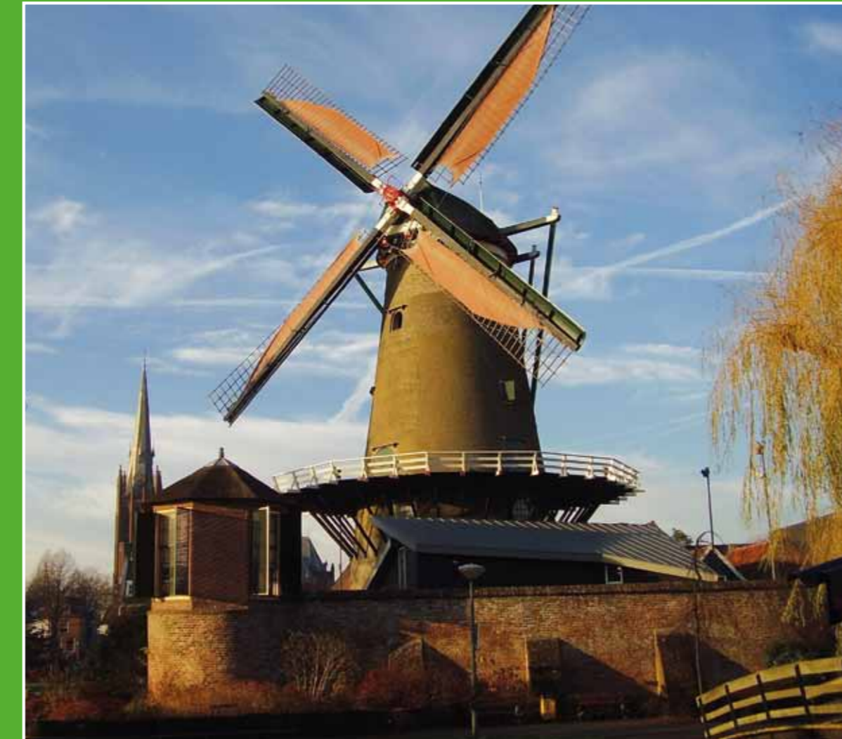
② Korenmolen De Windotter

In het Hollandse landschap van de polder Broek en Blokland liggen twee eendekooien: Eendekooi Blokland en Eendekooi IJsselstein. Deze eendekooien worden door Staatsbosbeheer met zorg beheerd vanwege de hoge cultuurhistorische waarde. De kooien zijn nog geheel 'vangklaar' en bezitten zelfs het kooirecht. Voor een kijkje achter de schermen kunt u contact opnemen met Staatsbosbeheer Groene Hart. Telefoon: 0184-640046. Internet: www.staatsbosbeheer.nl