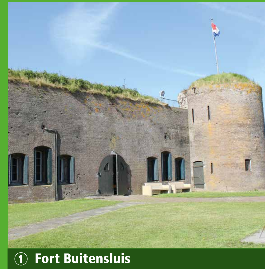
1 Fort Buitensluis