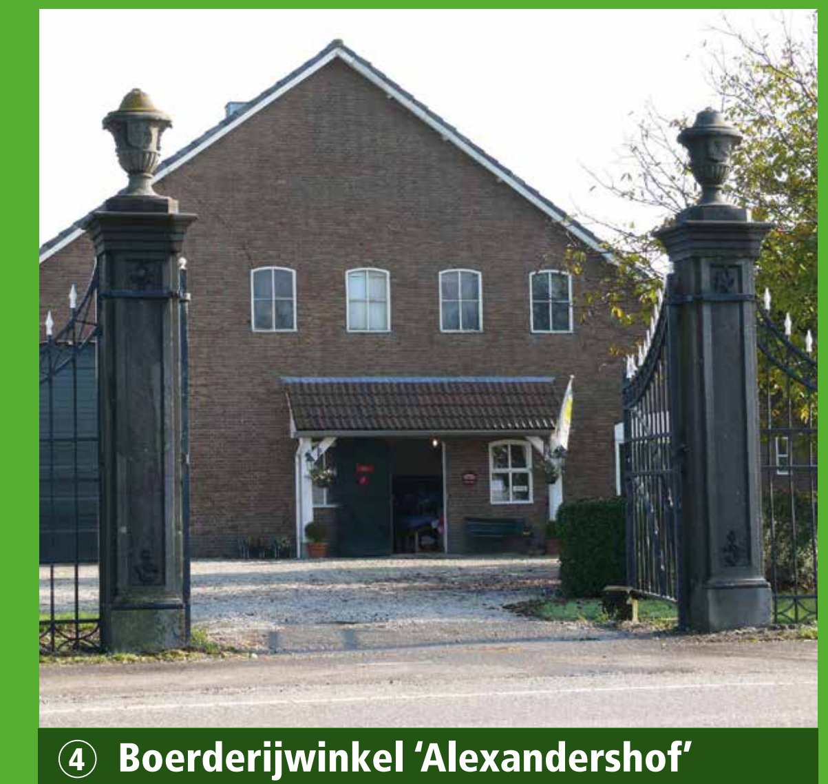
4 Boerderijwinkel 'Alexandershof'