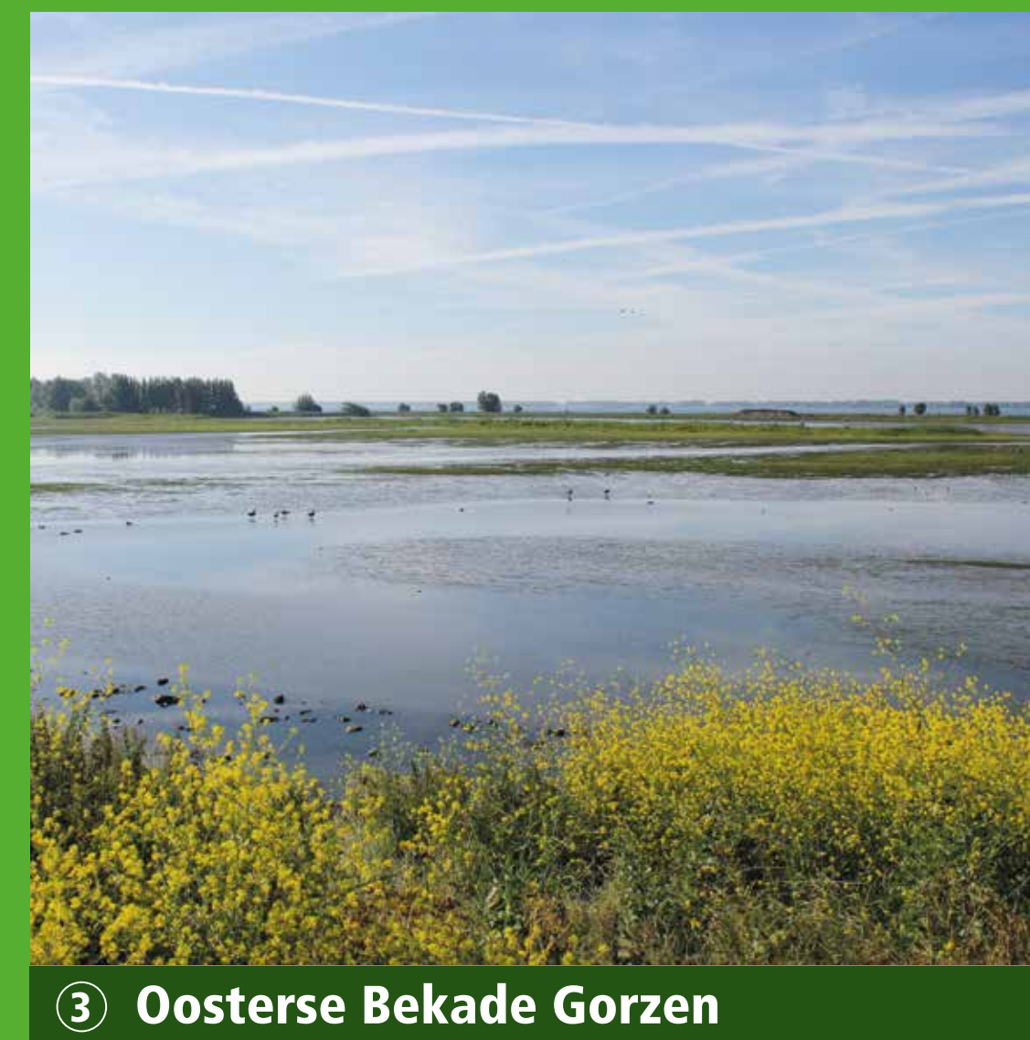
3 Oosterse Bekade Gorzen