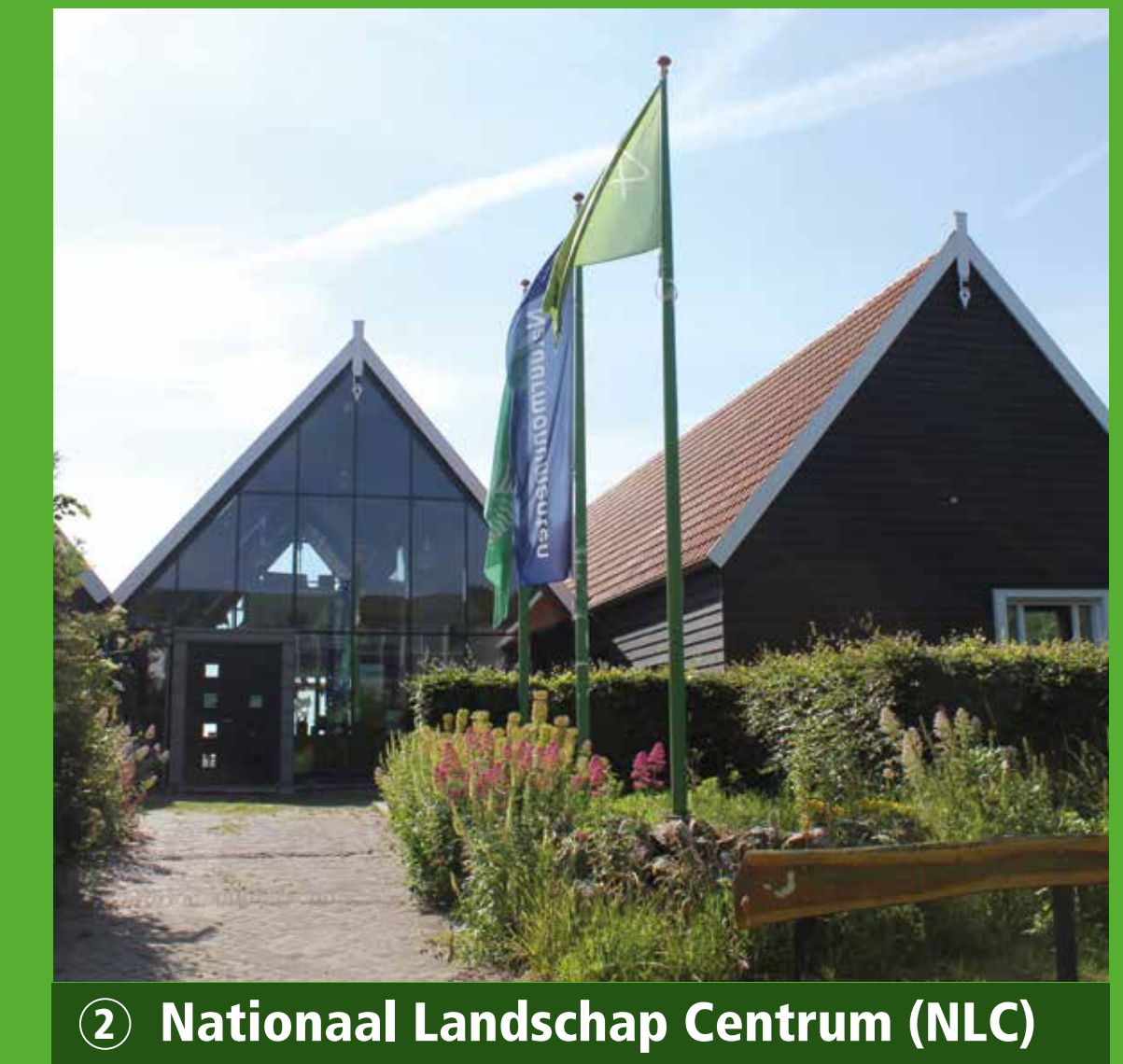
2 Nationaal Landschap Centrum (NLC)