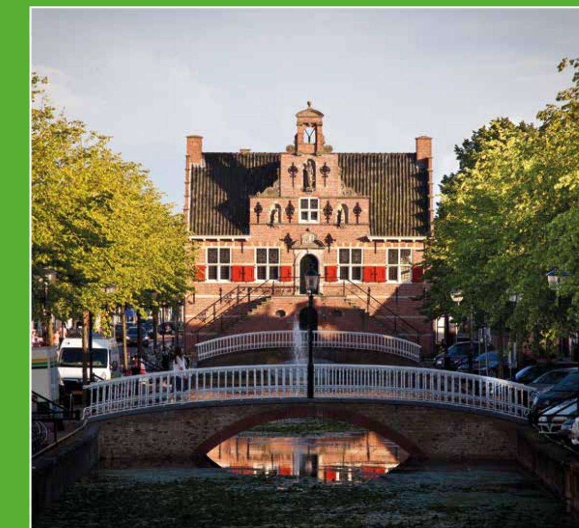
1 Historisch centrum Oud-Beijerland