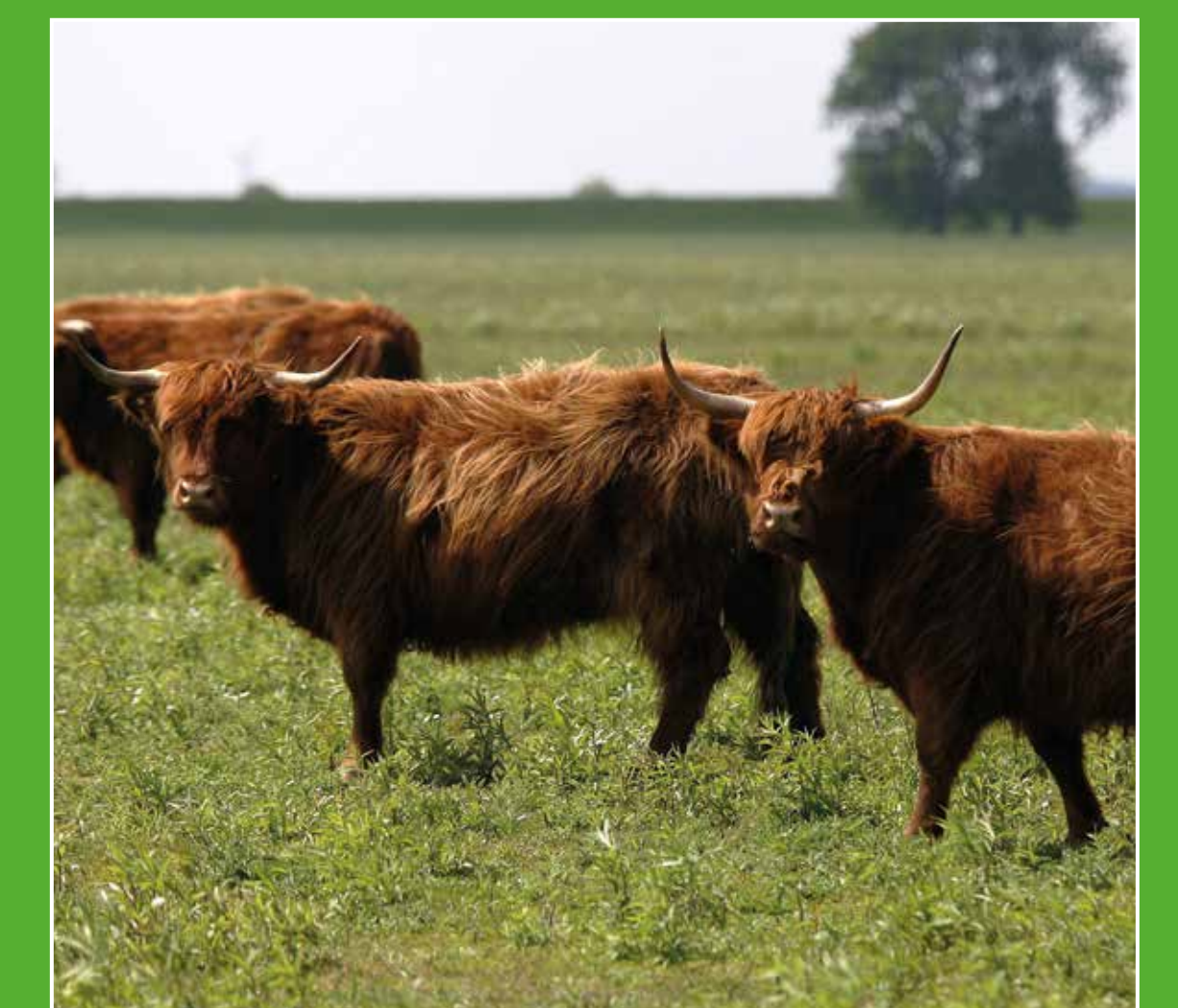
4 Natuureiland Tiengemeten