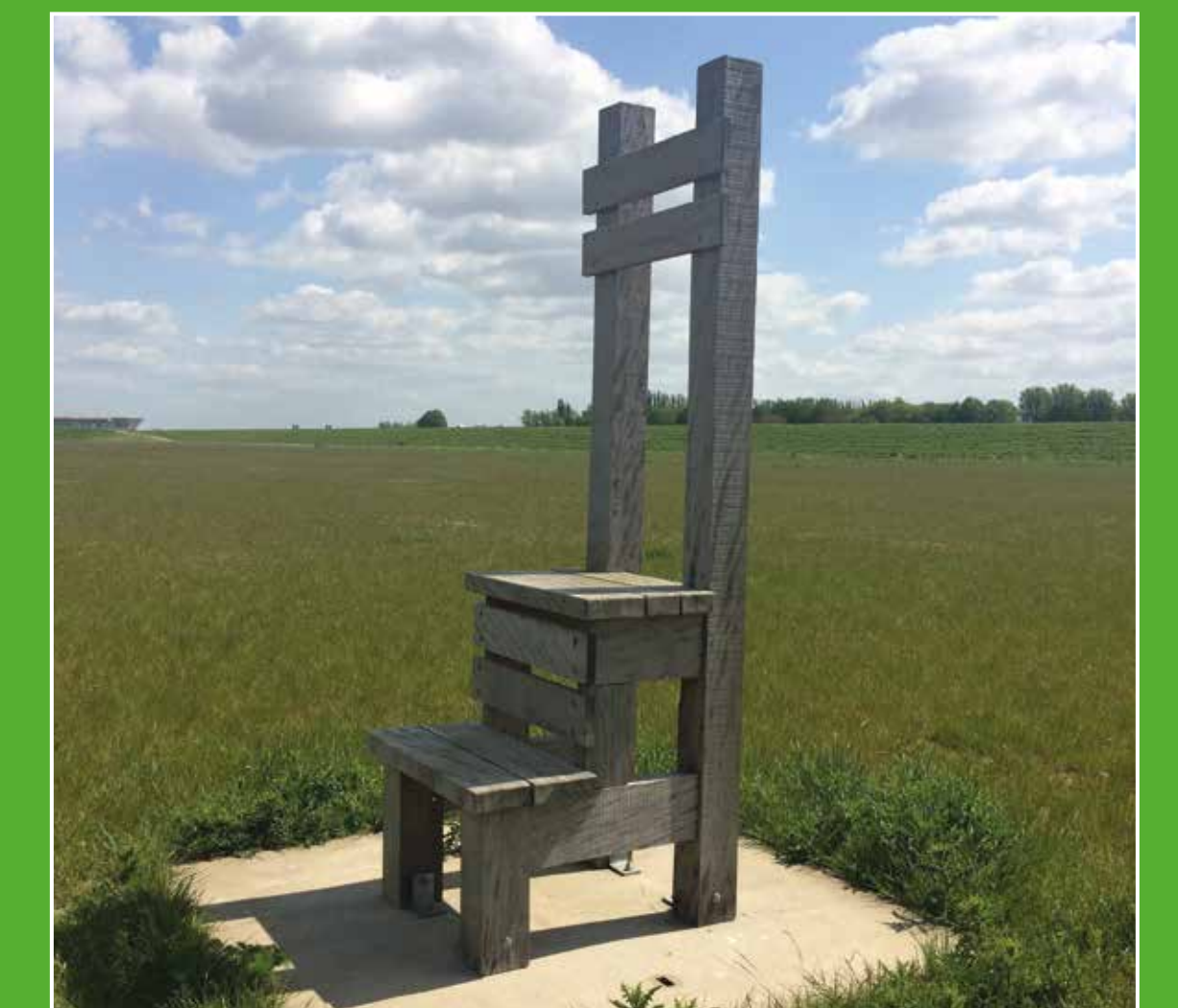
2 Recreatiegebied De Uitwaayer