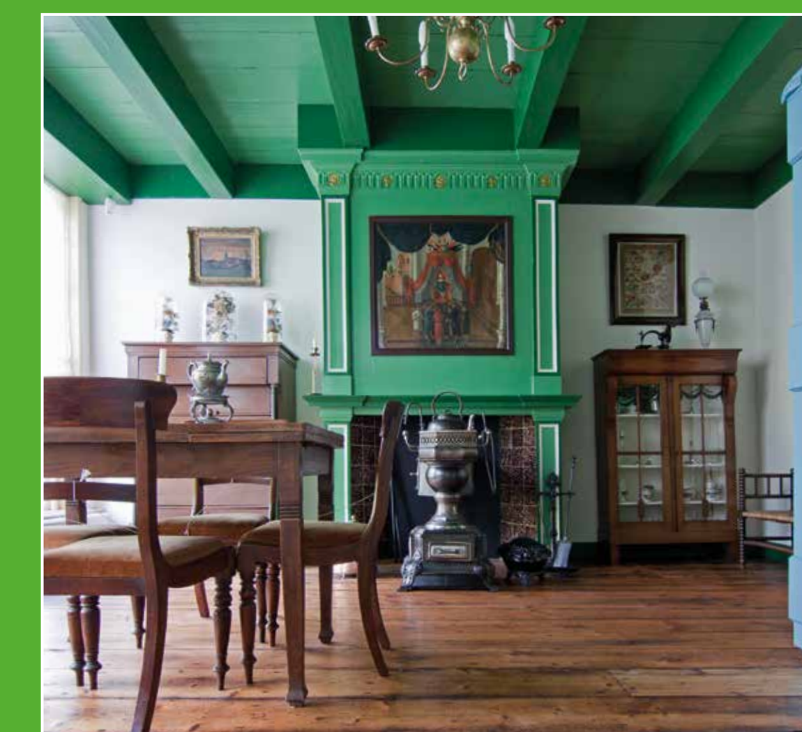
3 Museum Hoeksche Waard