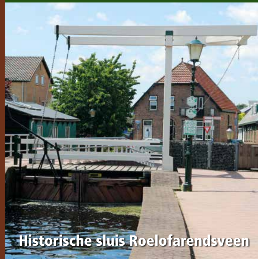
Historische sluis Roelofarendsveen