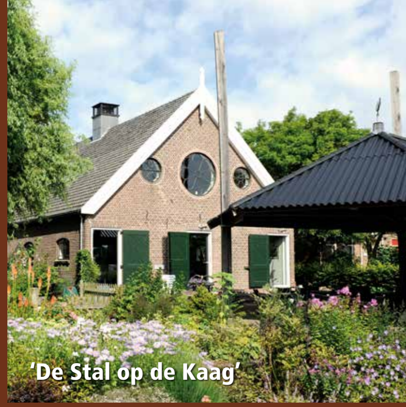
De Stal op de Kaag