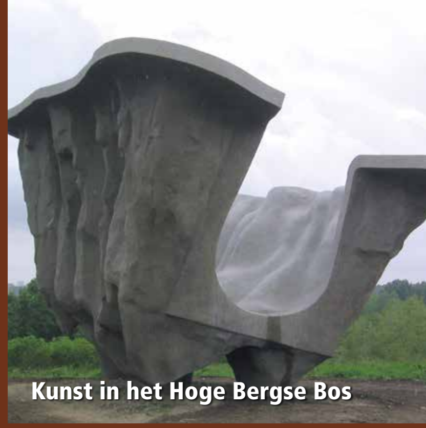
Kunst in het Hoge Bergse Bos