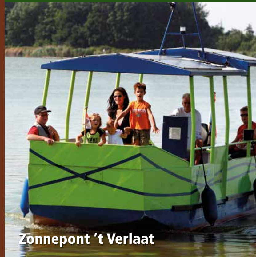
Zonnepont 't Verlaat