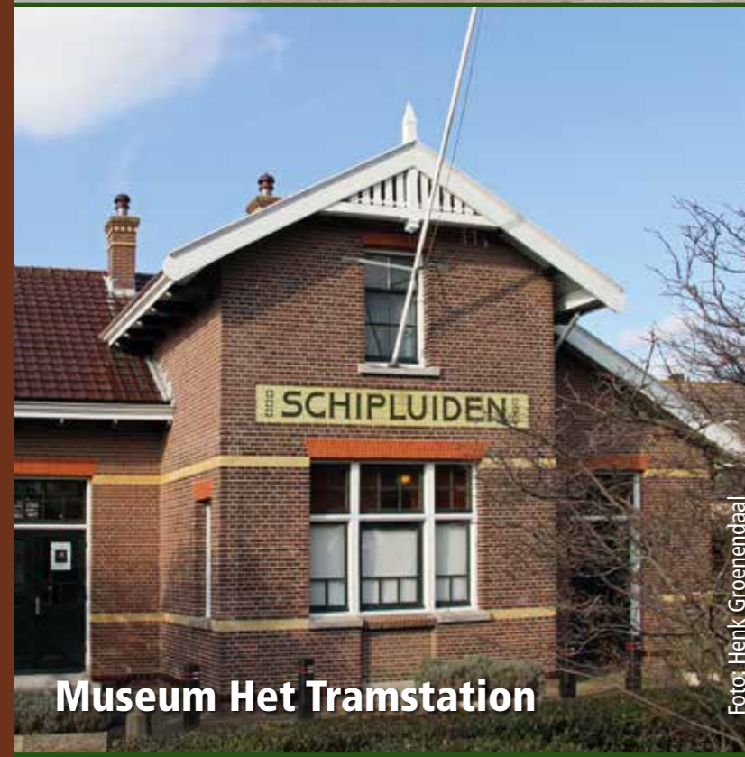
Museum Het Tramstation