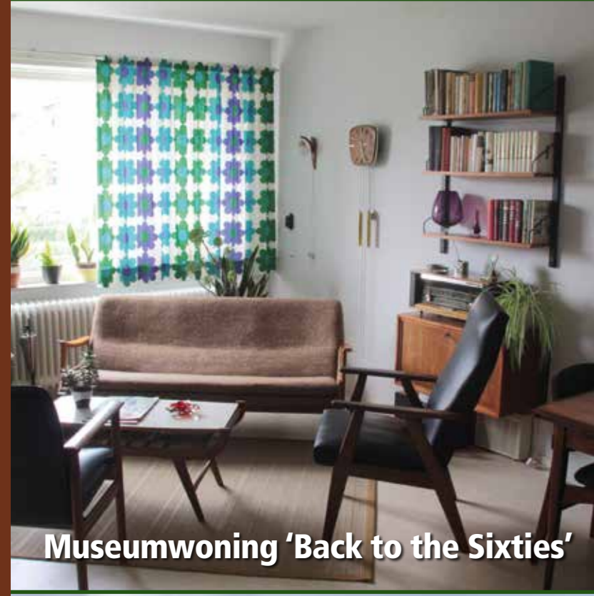
Museumwoning 'Back to the Sixties'