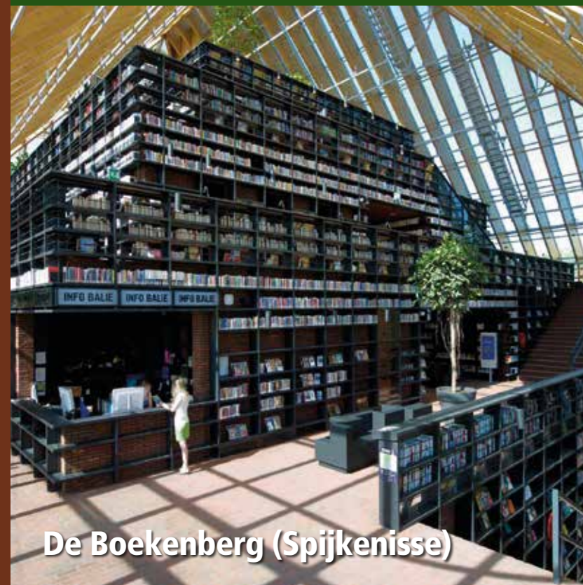
De Boekenberg (Spijkenisse)