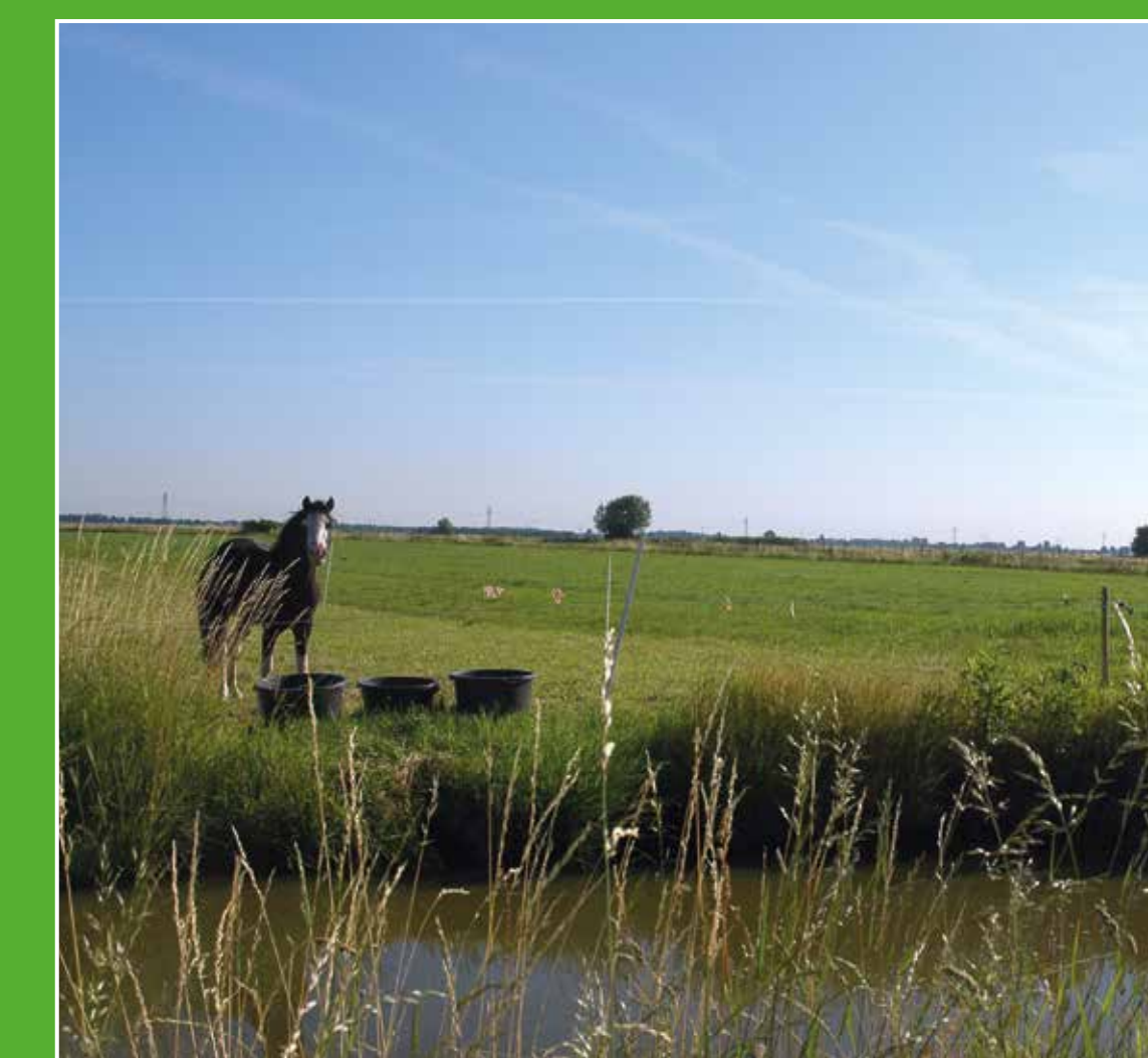
3 Oudeland van Strijen