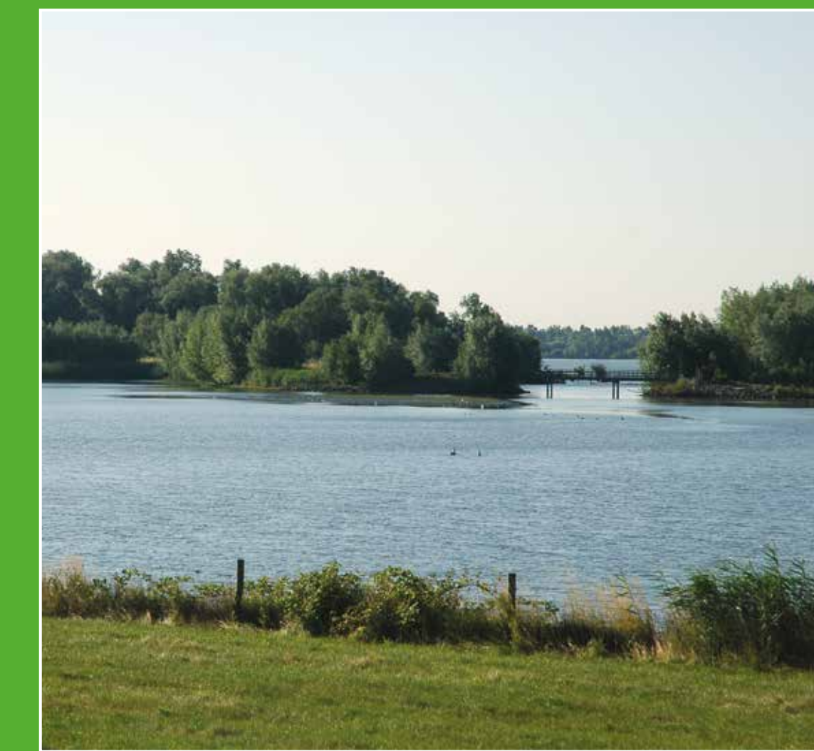
1 Oeverlanden Hollands Diep