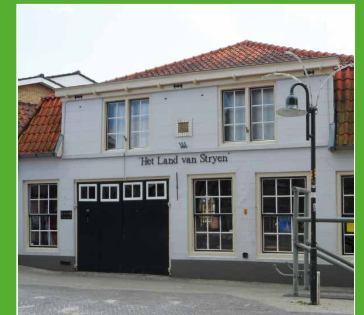
2 Museum 'Het Land van Strijen'