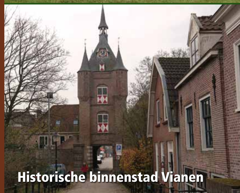
Historische binnenstad Vianen