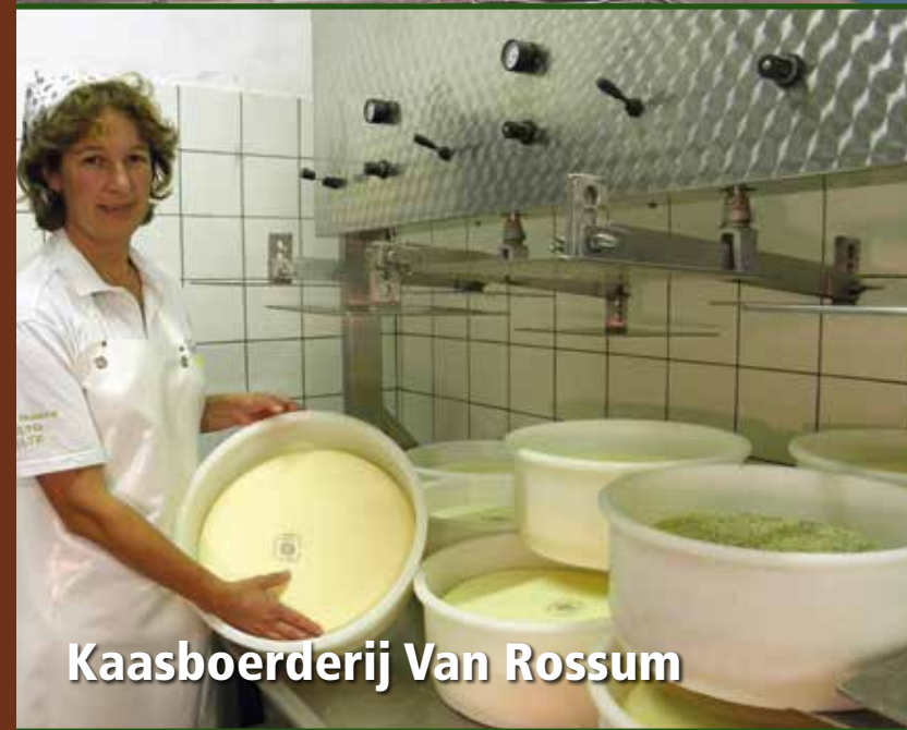
Kaasboerderij Van Rossum