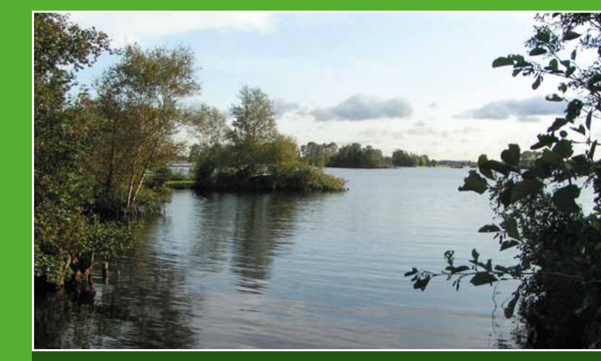
4 De zandeilanden

In Abcoude ligt het oudste landfort van de Stelling van Amsterdam, een 135 kilometer lange verdedigingslinie. Dit fort is gebouwd tussen 1884 en 1887 en is onderdeel van het UNESCO Werelderfgoed. De Slot Abcouderoute geeft u al wandelend een mooi uitzicht over het fort, dat zelf niet vrij toegankelijk is.