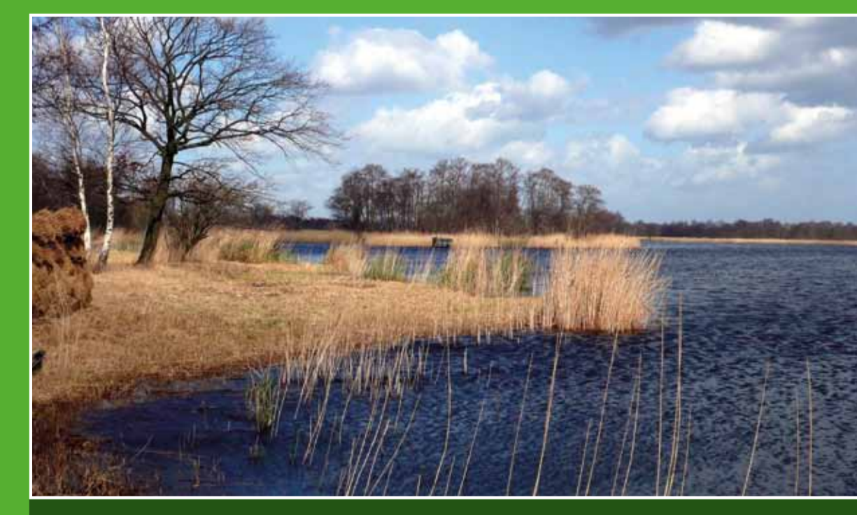
2 Natuurgebied Botshol

Het museum De Ronde Venen is ontstaan vanuit een particuliere collectie en toont de landschapontwikkelingen in dit bijzondere veengebied. Aan de hand van een uitgebreide collectie wordt het verhaal van de turfstekers en veenbazen verteld. Ook vindt men hier de laatste, volledig intact gebleven veensteekmachine van Nederland. Adres: Herenweg 240, Vinkeveen. Openings tijden: apr. 1 st okt. wo 1 st m zo 14.00-17.00 uur.