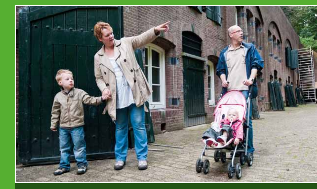
3 Fort Abcoude

In de Botshol, een natuurreservaat van Natuurmonumenten, spelen veenweiden, rietland, moerasbos, weidevogels en waterlilies de hoofdrol. Het gebied is alleen met de kano of roeiboot toegankelijk en alleen buiten het broedseizoen. Voor wandelaars is de Botsholroute uitgezet die langs dit prachtige natuurgebied gaat.