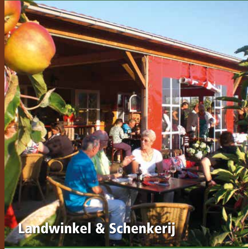
Landwinkel & Schenkerij