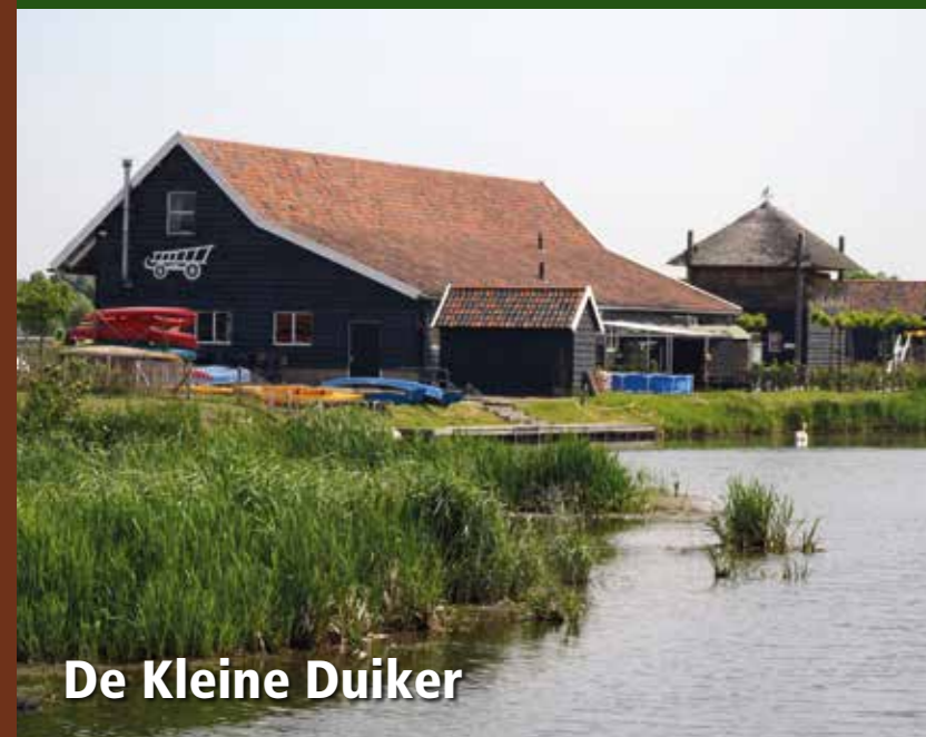
De Kleine Duiker