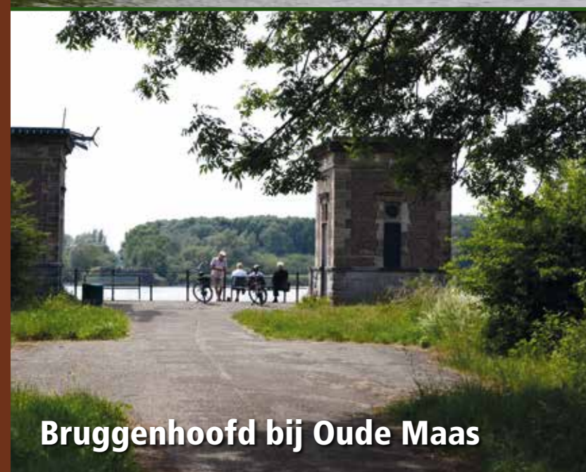
Bruggenhoofd bij Oude Maas