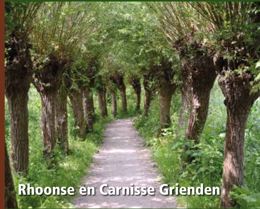
Rhoonse en Carnisse Grienden